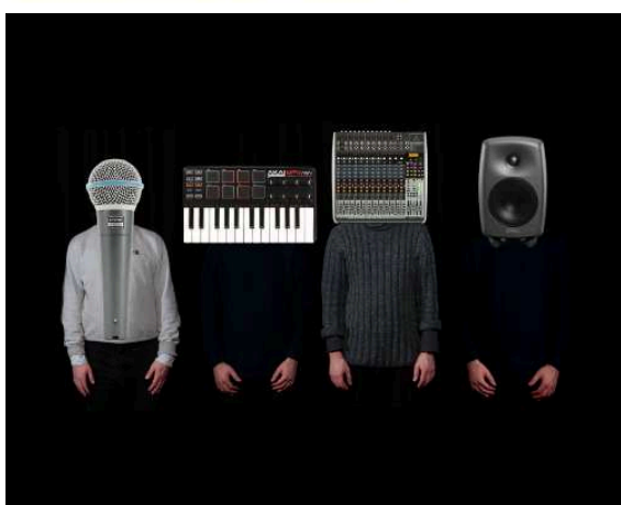
Current Resonance (composer-performer ensemble) ( https://www.facebook.com/currentresonance )