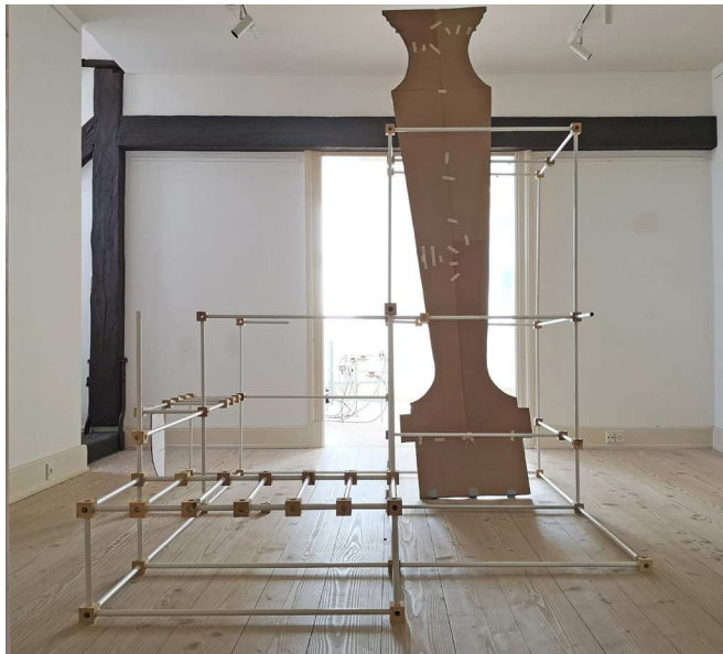
Klavs Weiss Brydningstid, 2024.