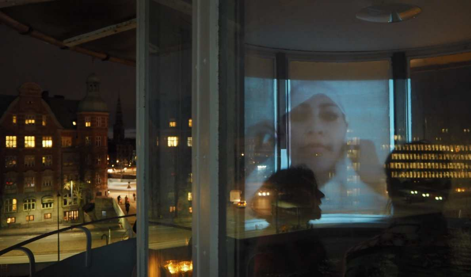
RorgASM solo udstilling / screening af " I am..." 01.00 loop fra aften til morgen / Marts-April 2019 / Kulturtårnet CPH knippelsbro