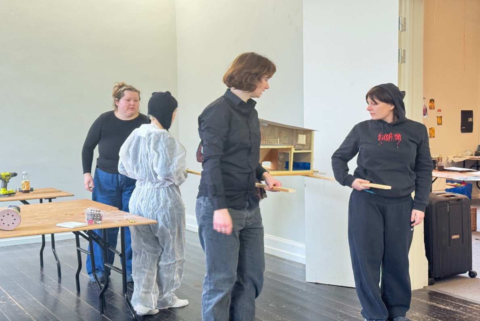
THE PORTAL / PORTALEN / THE DOLL HOUSE - SITE SPECIFIC ART SPACE AT THE FOYER OF FUNEN ART ACADEMY/ FEB-MARCH 2025

Forberedelse til offentlig procession, Portalen, med portalen der endnu er rå, koordinering af bærenes position.