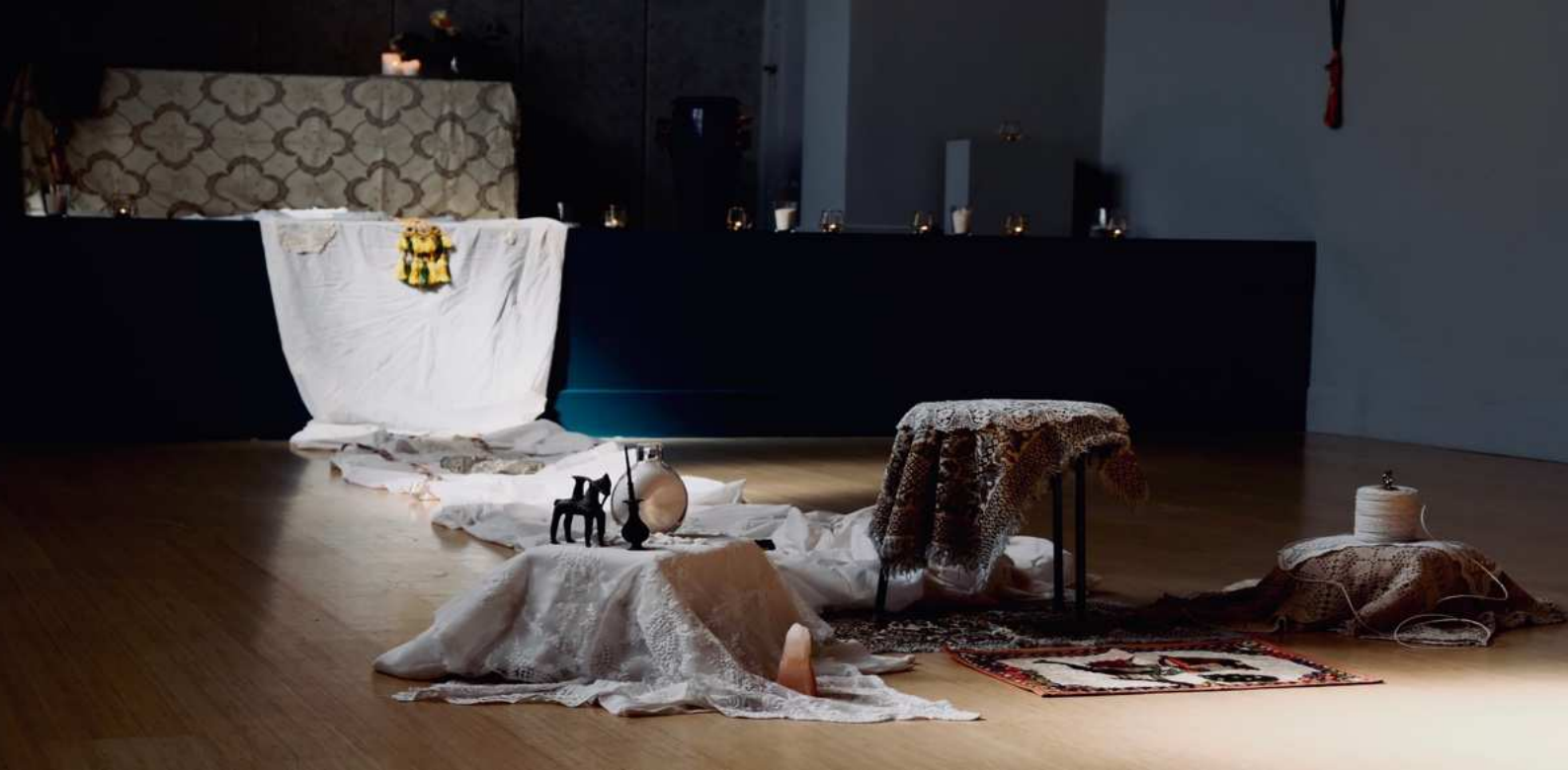
ORAKLET FRA LAHORE / PERFORMANCE / PERFORMANCE SET-UP/ LAKE HOUSE - NØRREBRO / FOYERcontemporary ART MATTER FESTIVAL 2025