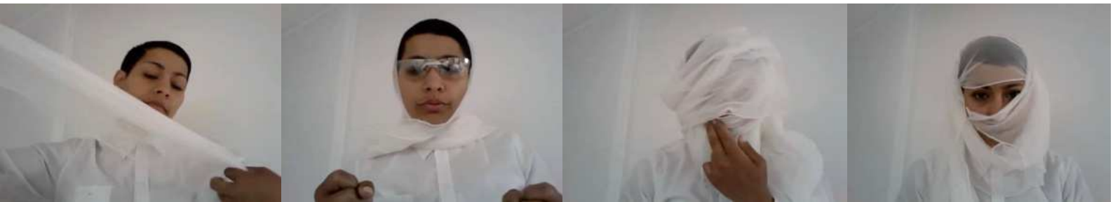
FOTO STILLS " I AM... LOOP" 01.00 min 2012 / Screened also at the Solo Show at RorgASM 2019