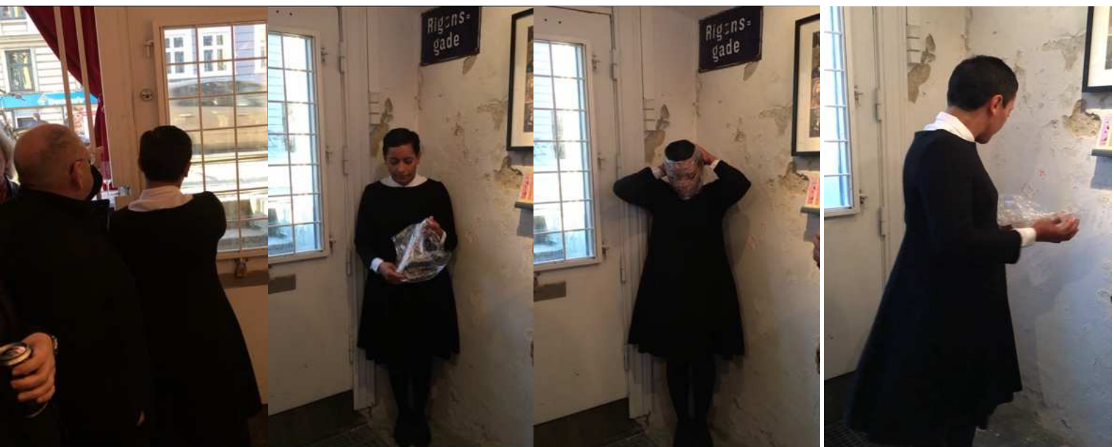
BREATH IN AND BREATH OUT / PERFORMANCE 04.12 min live/ BLACK BOX GALLERY/ opening programme October 2016

" Breathe in and Breathe out" eksperimenterer med stoflighed og lyd.