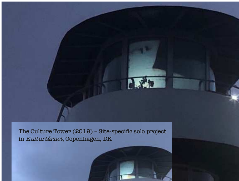
The Culture Tower (2019) - Site-specific solo project in Kulturtårnet , Copenhagen, DK