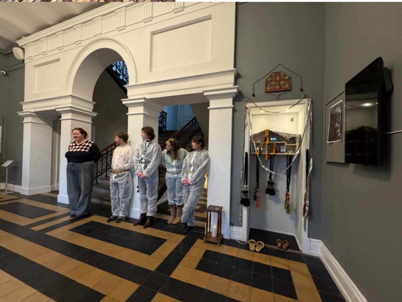
THE PORTAL / PORTALEN / THE DOLLHOUSE / PORTALEN INDVIES I RUMMET EFTER PERFORMANCE PROCESSIONEN MED PORTAL BÆRERNE 06.02.2025

Portalen bliver et tempel, et sted for ritualer og healing.