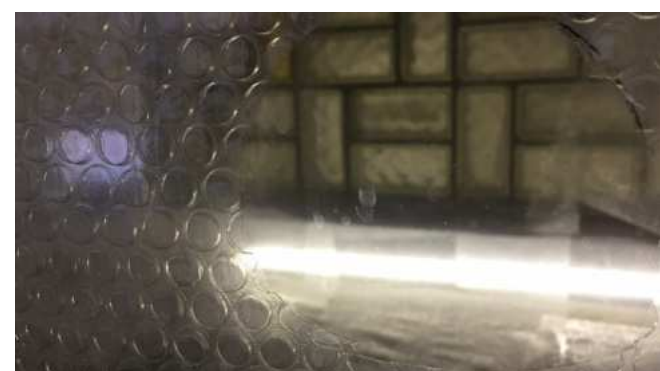
Et rundt hul i bobleplasten der dækker døren så der kan kigges ind af beluren.

Breathe in and Breathe out Video installation 03:50 min loop, Das Klohäuschen, München, 2016. Hele rummet indvendigt indpakket og lukket af med bobleplast. Små runde huller skåret så børn kan kigge ind gennem døren, voksne må bøje sig. Døren med lille lem - forstærket vejtrækning lokker beskueren. Inde i det lukkede rum: video på gammelt TV viser kunstneren med intimistisk bobleplasthætte, vejtrækningens rytme som livets kamp. Beskueren holdes udenfor, kan kun fornemme et liv gennem lyd og kig - svært besnærende men upassende at overvære