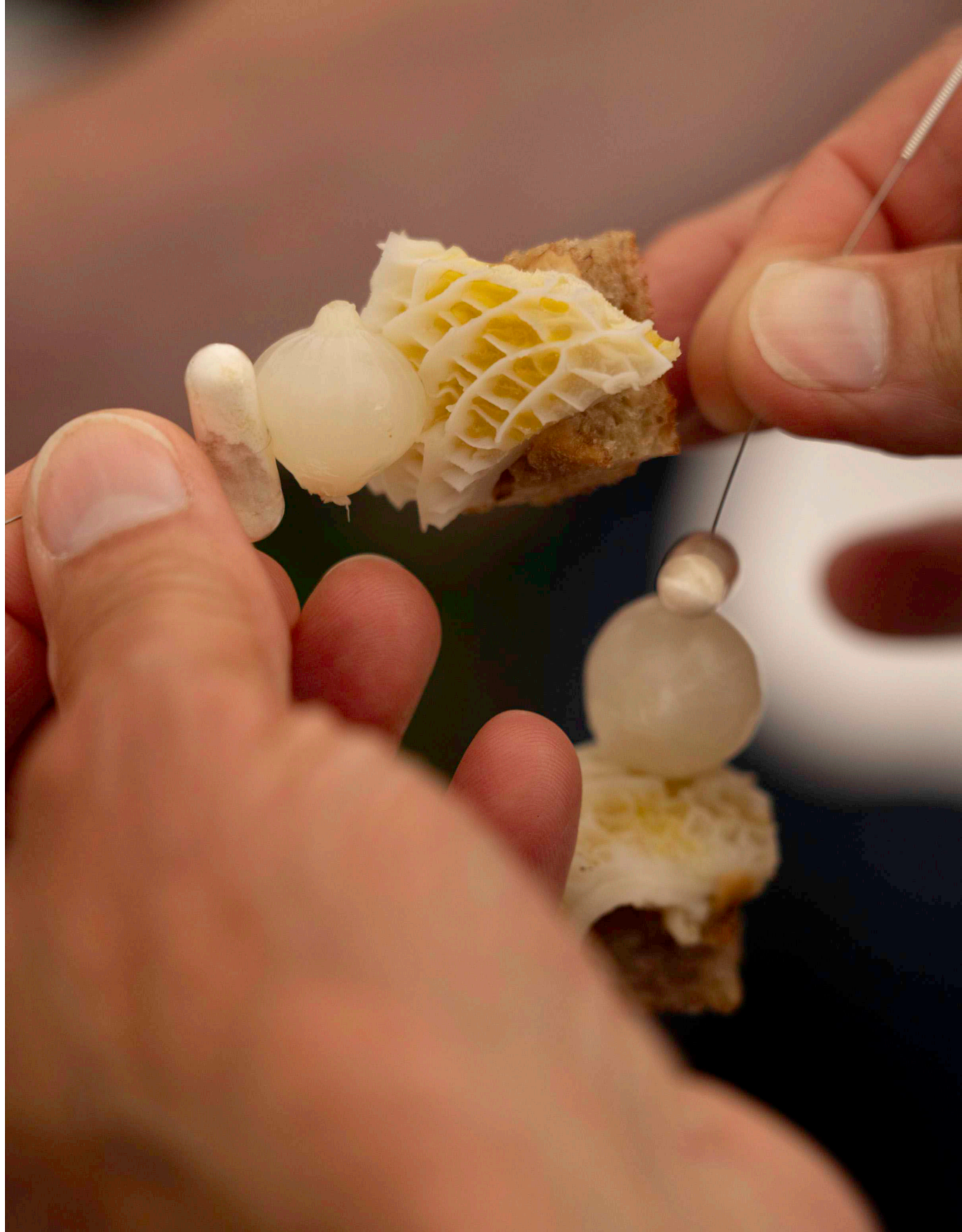
Enhancing the Gut Feeling, 2024

Denne spiselige skulptur er et forsøg på en servering, der understøtter maven som et organ, vi tænker med, i stedet for udelukkende at overlade den aktivitet til hjernen. Serveringen inderholder ingredienser, der er gode for tarmens mikrobiota så som probiotika, præbiotika og fermenter. Andre ingredienser har til formål at forbedre forbindelsen mellem maven og dens omgivelser gennem forskellige metoder og strategier så som akupunktur og WiFi-routers.