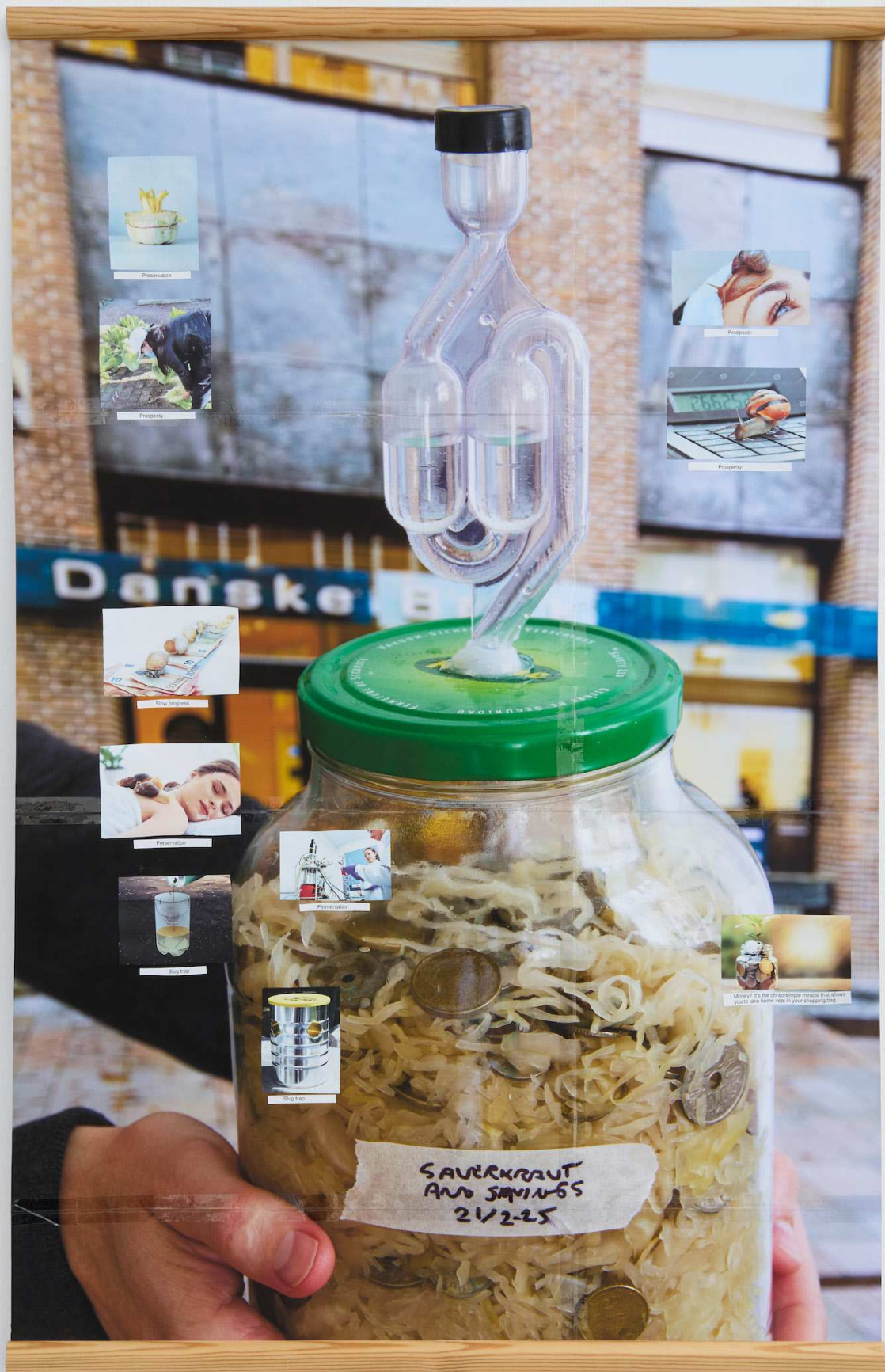
Sauerkraut and Savings 21/2-25, Kollage på print, tape, fyrretræ, 96,2 x 61,8 cm. Serie af 10 kollager, der indgik i middagsudstillingen Cooking Your Spirit Animal , Den Frie Udstillingsbygning og Inside-Out Art Museum, Beijing, 2025