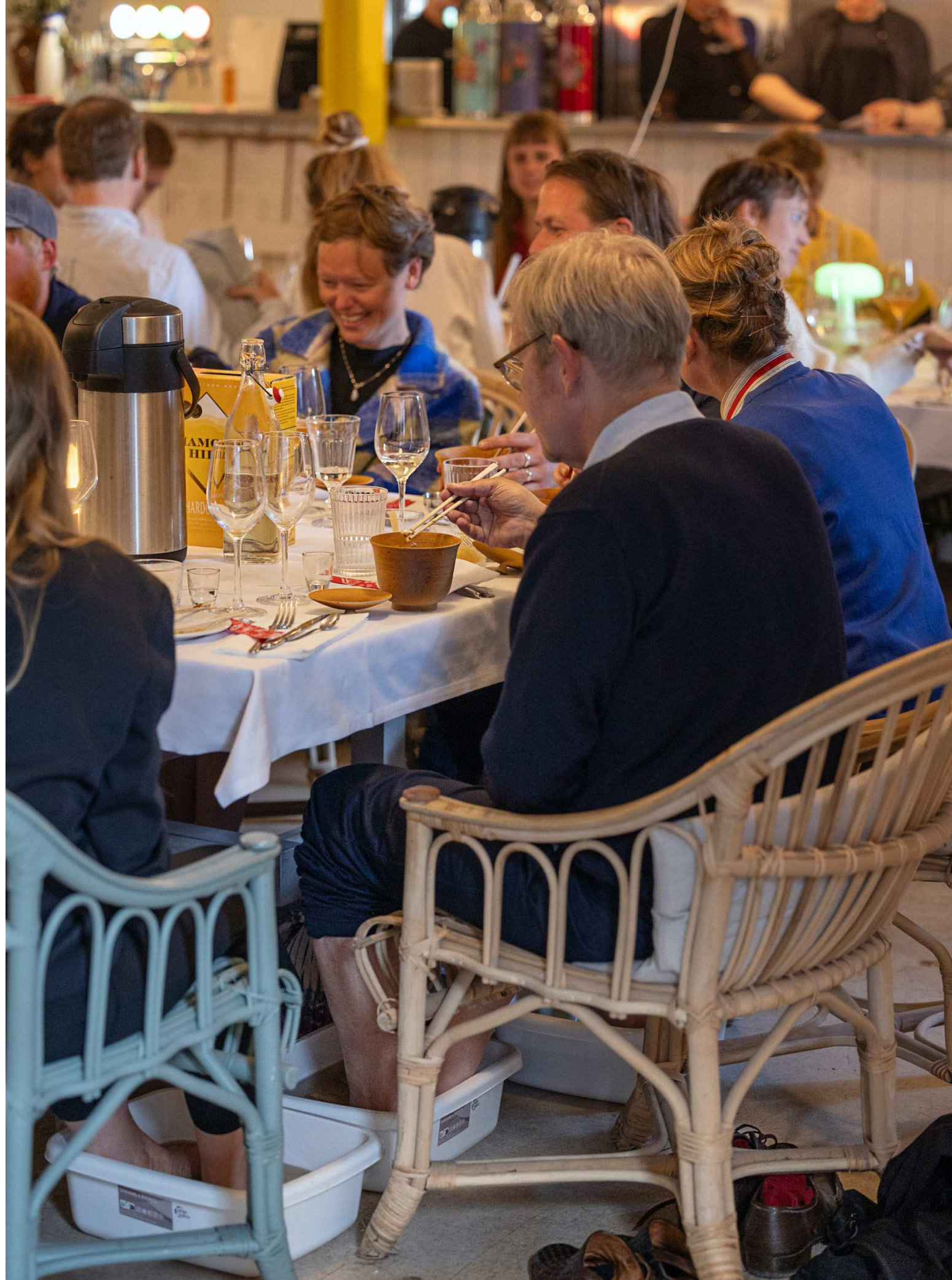
Instant Noodle Pig Snout Truffle Soup with Sensibility Tea Foot Bath Soup, Gæsterne fik serveret samme suppe i deres skåle og fodbad, 2025