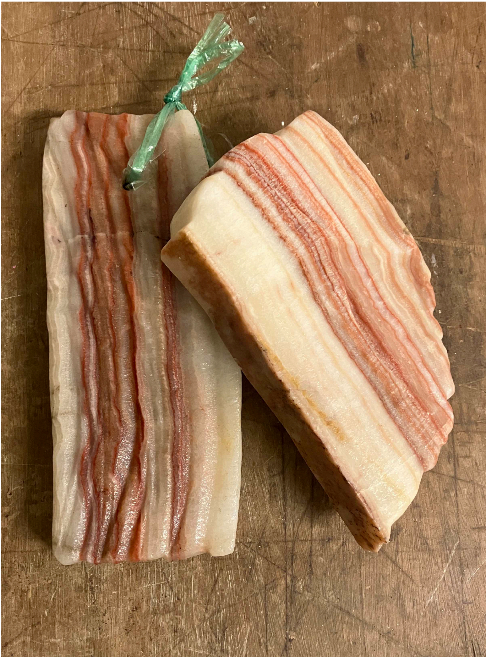
SKITSE til skulptur med rødbåndet calcitsted, skåret ud i facon som bacon.