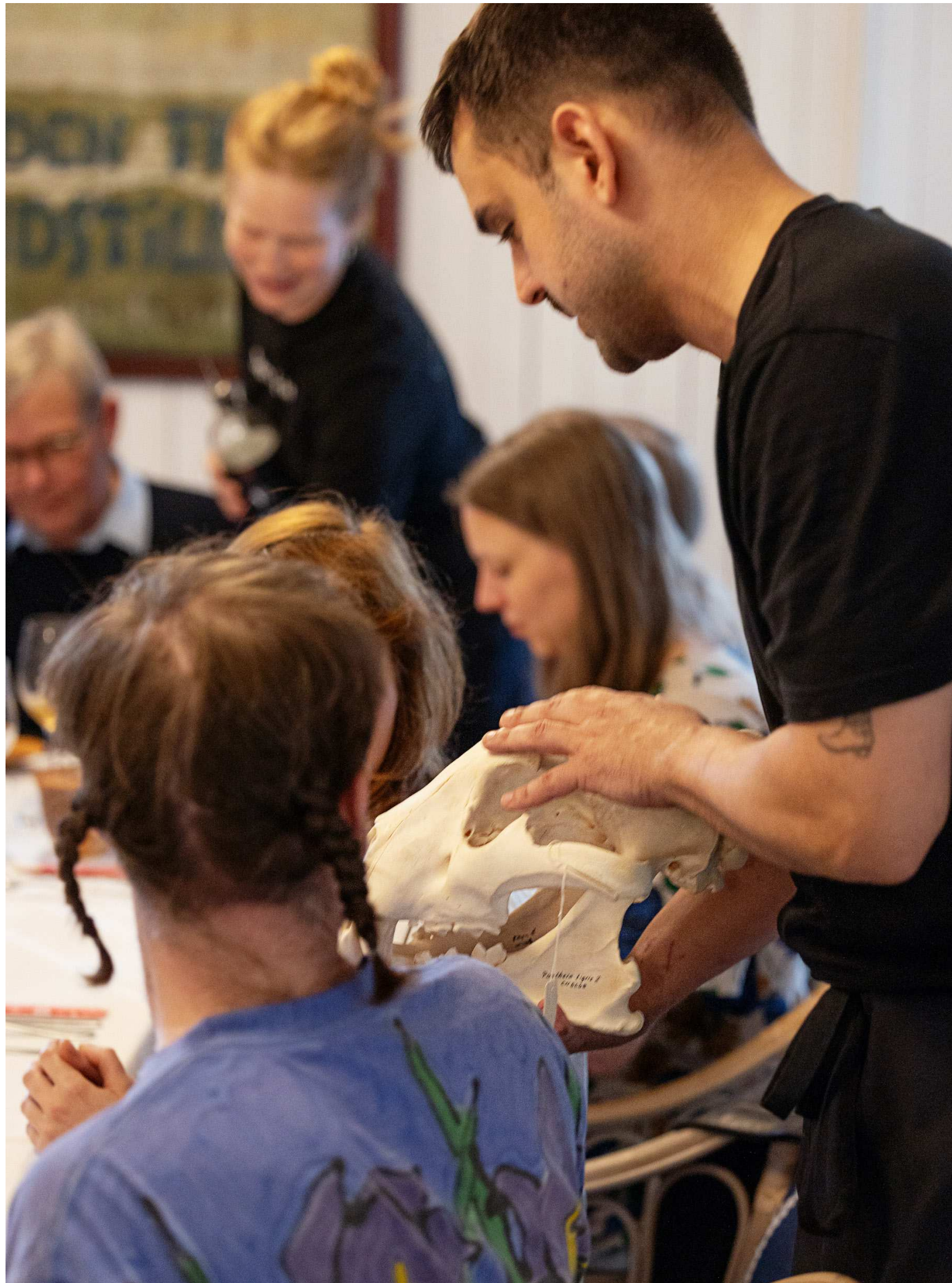
Instant Noodle Pig Snout Truffle Soup with Sensibility Tea Foot Bath Soup. Før servering blev et tigerkranium spejlet i suppen og fodbadet for at skræmme onde ånder væk (efter en scene i Murasaki Shikibus dagbog), 2025