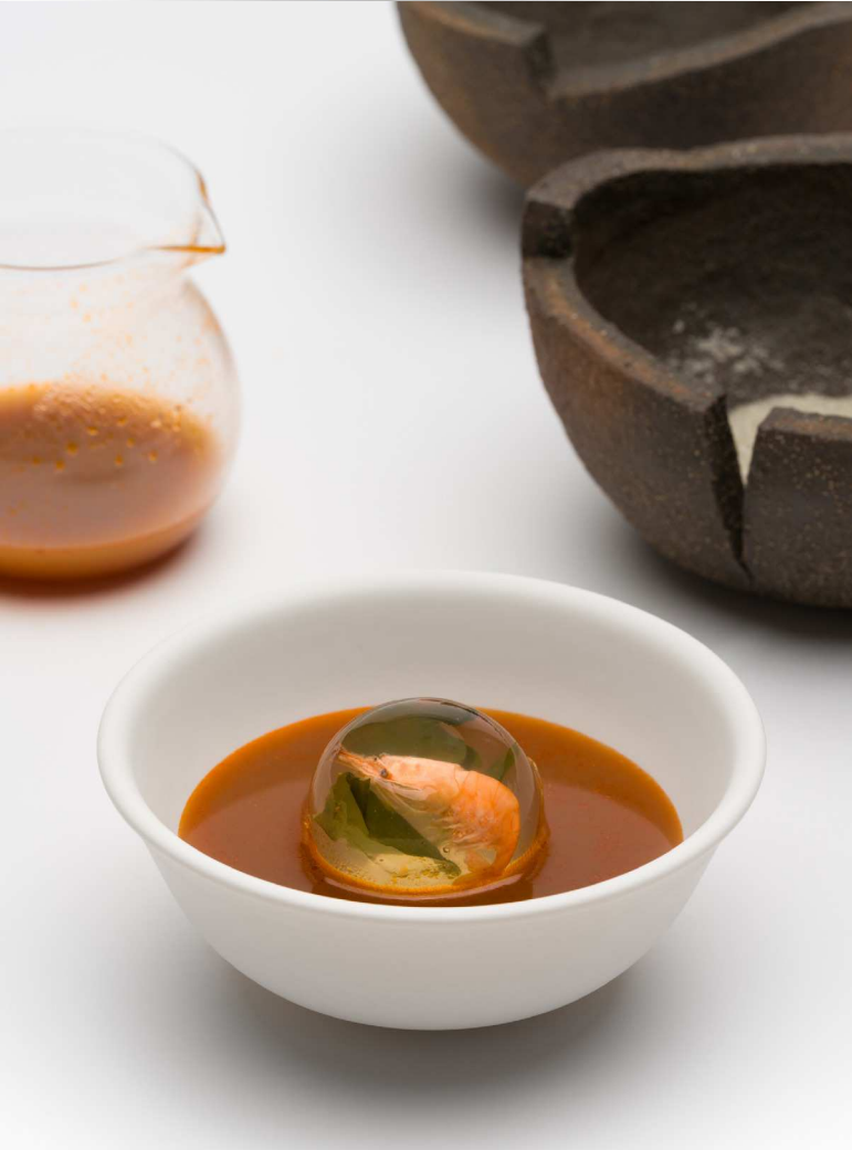
Shrimp Soup Ceremony, 2023