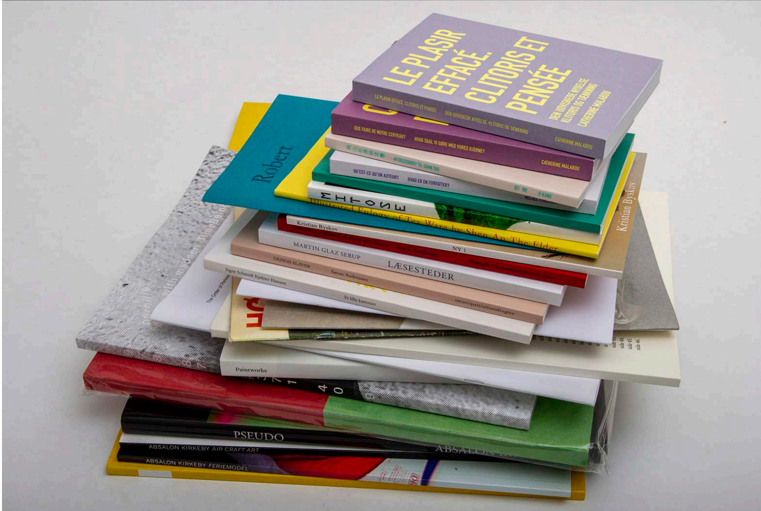
Øverst: Udvalg af egne udgivelser, 2025