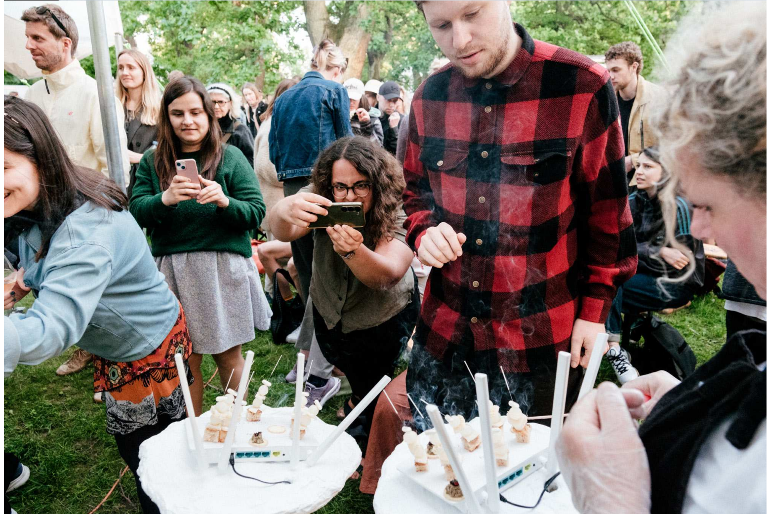
Enhancing the Gut Feeling, Undertilberedt kalvemave, fermentede løg og jordskokker, surdejsbrød, miso pasta, probiotika-kapsler, akupunktur nåle, moxa (tørret bynke), ingefær, røgelse, WiFi-routers, forlængerledning, gips, maling og bambus, Variable mål, 2024