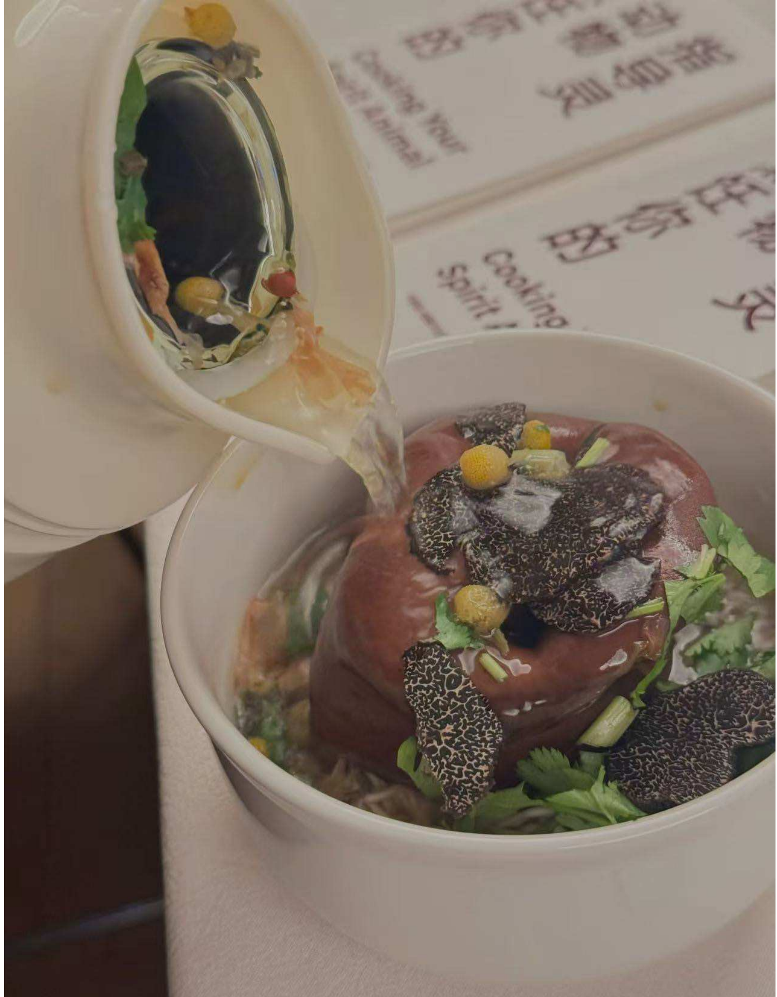
Instant Noodle Pig Snout Truffle Soup with Sensibility Tea Foot Bath Soup , Grisetryne, instantnudler, trøffel, forårsløg, bouillonpulver ala Japan, teriyakisauce, sensibility tea suppe med ingefær, kamilleblomst, koriander, citronmelisse, lavendel, rosenblade, rosenpeberkorn, vodka, stentøj, balje og refleksion af tigerkranium, Variable dimensioner. Serveringen var en del af middagsudstillingen Cooking Your Spirit Animal , Den Frie Udstillingsbygning og Inside-Out Art Museum, Beijing, 2025.