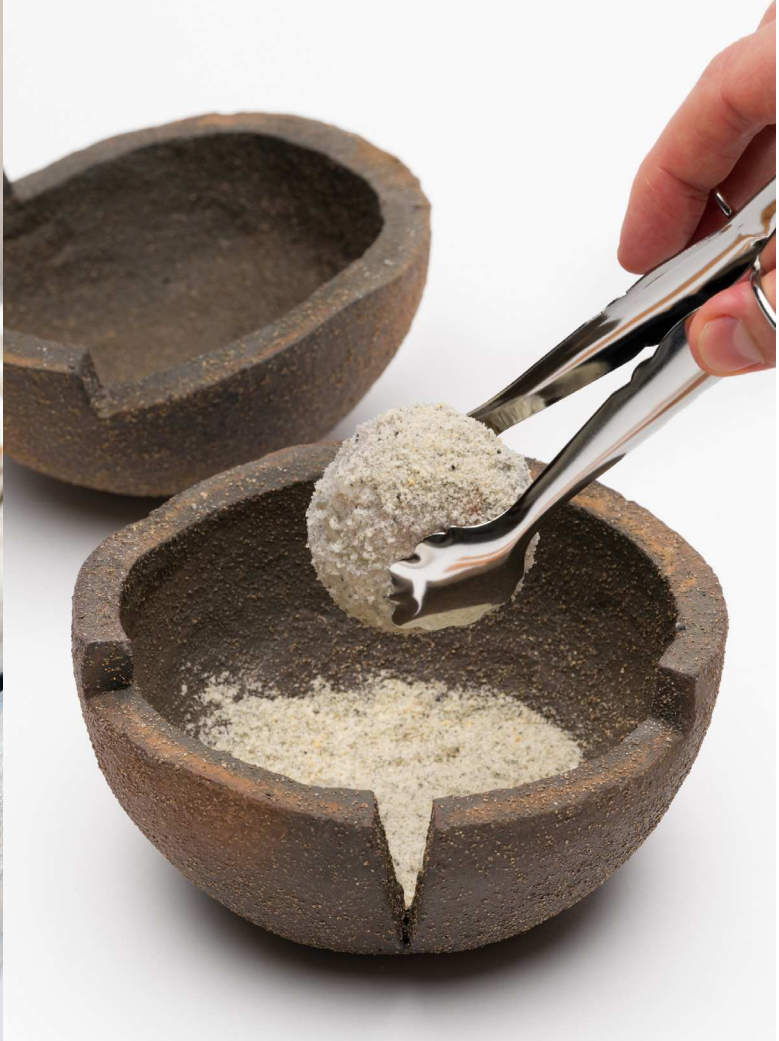
Shrimp Soup Ceremony , Rejer, wakame-tang, sosa, spiseligt sand, suppe, stentøj, porcelæn, glaskande, tang, spisepinde, hulske, HolaBot robottjener, Variable mål. Den spiselige skulptur blev serveret af en robottjener på restauranten Høfde4 som en del af gruppeudstillingen First There Is a Mountain , Wadden Tide, 2023