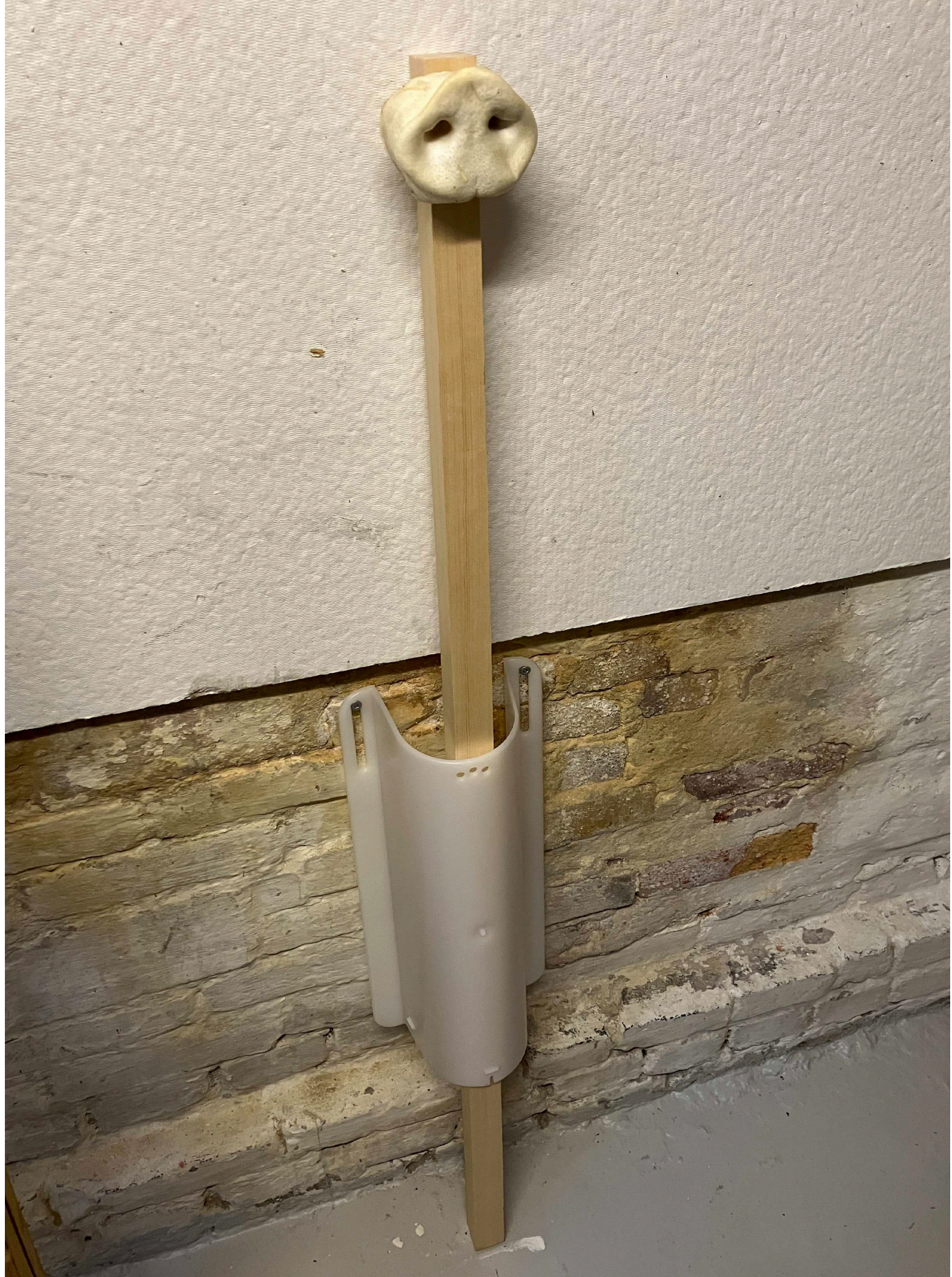
SKITSE til skulptur ( Ghosts ) med tørrede grisetryne og "fun bar", der er godkendt som rodemateriale i dansk svineproduktion.