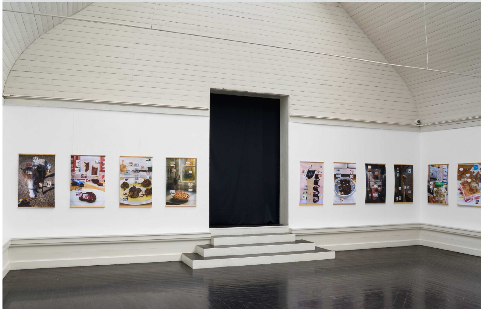
Øverst tv: Situated Brains , Kollage på print, tape, fyrretræ, 96,2 x 61,8 cm.