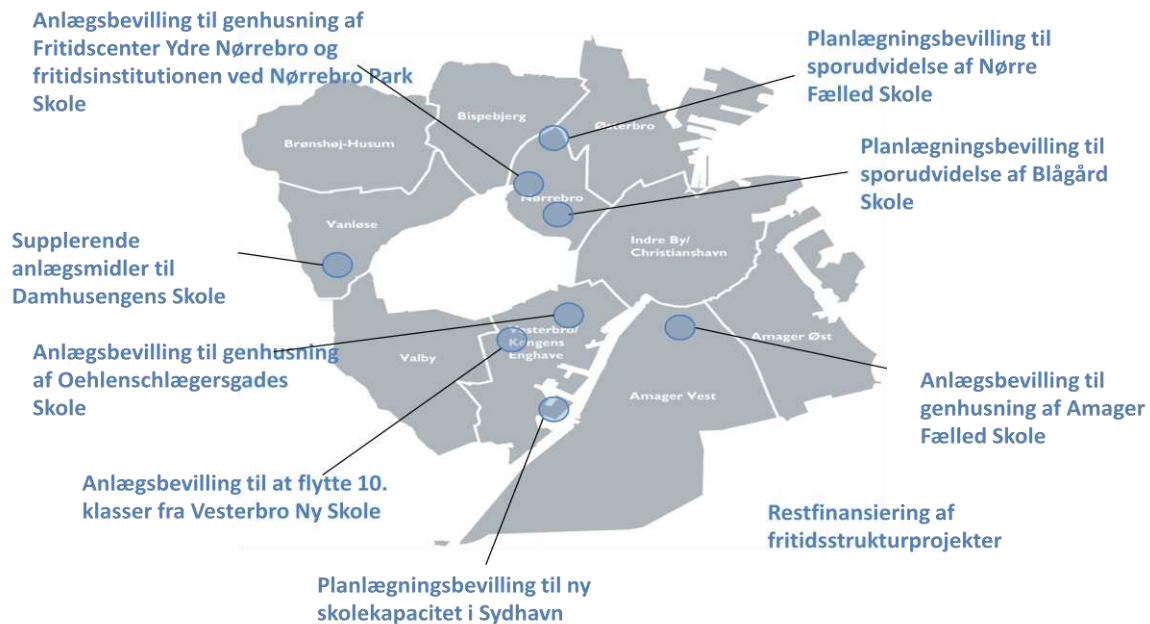
Figur 2. Budgetønsker på skoleområdet i overførselssagen 2017/18

Som opfølgning på budget 2018, er der endvidere udarbejdet et budgetønske på etablering af en udeskole i Hans Tavsens Park. Budgetønsket skaber ikke mere kapacitet, og det er derfor ikke fremlagt som need to forslag.