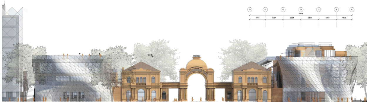
Projektet som det så ud tidligere