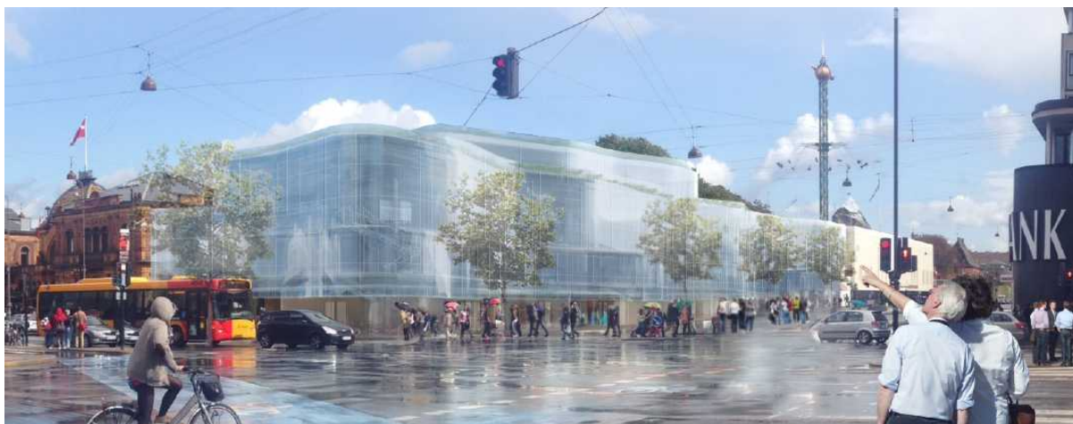
Projektet som det ser ud nu