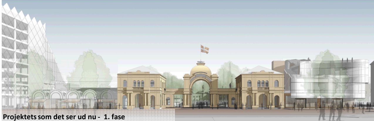
Projektets som det ser ud nu - 1. fase