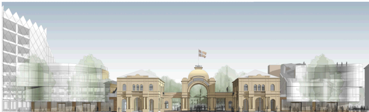
Projektet som det ser ud nu.