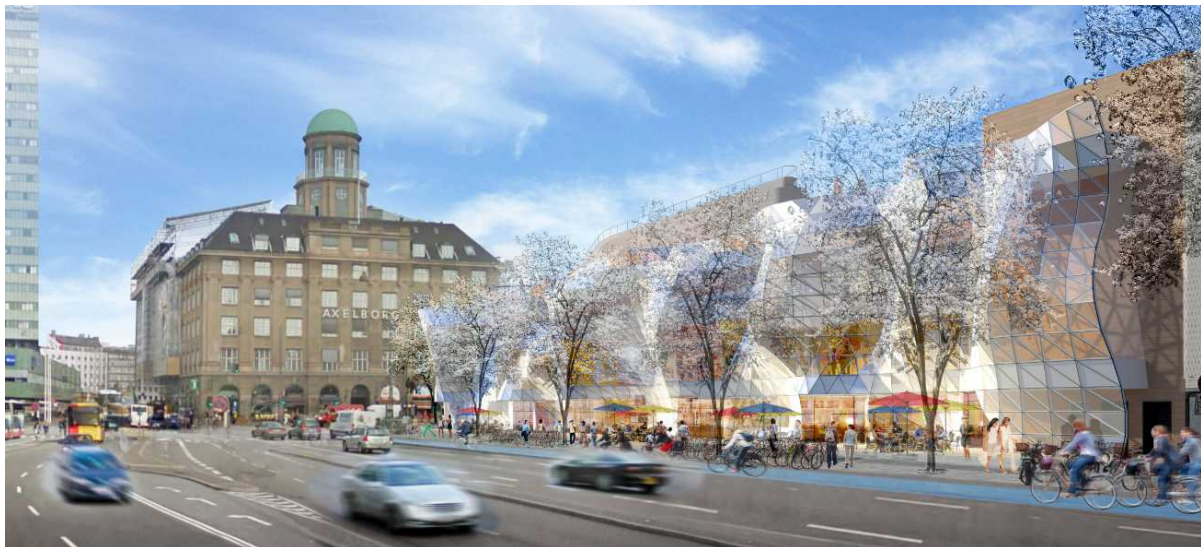
Projektet som det så ud tidligere