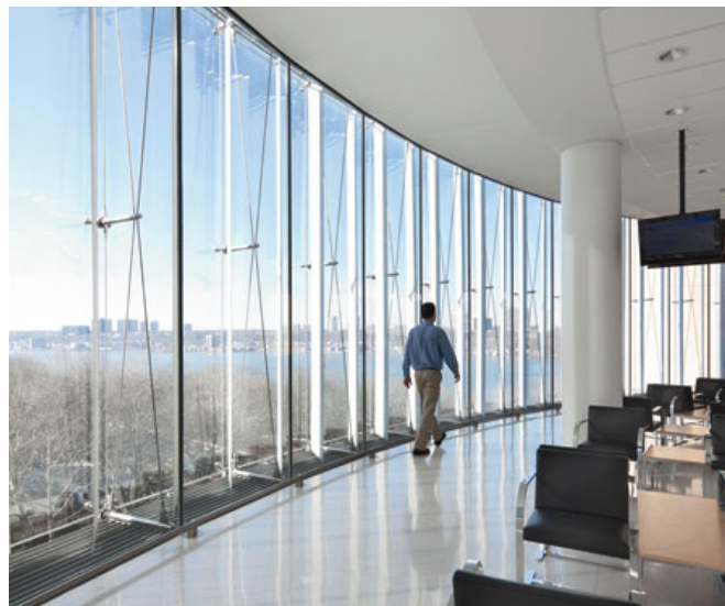
Referencfoto af lodret solafskærmning, som tænkes anvendt på hjørneprojektet. Foto fra Vivian and Seymour Milstein Family Heart Center, Presbyterian Hospital, 2010. Ill. og tegnet af Pei, Cobb Freed & Partners.

KØBENHAVNS KOMMUNE Teknik- og Miljøforvaltningen