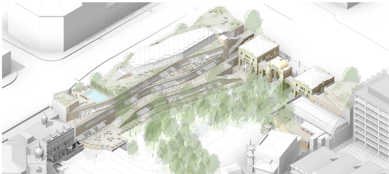
Projektet set fra luften mod Tivolihaven, hvor projektet består af en række terrasser og trapper med adgang til Tivoli og taghaven. Ill. Pei Cobb Freed & Partners.