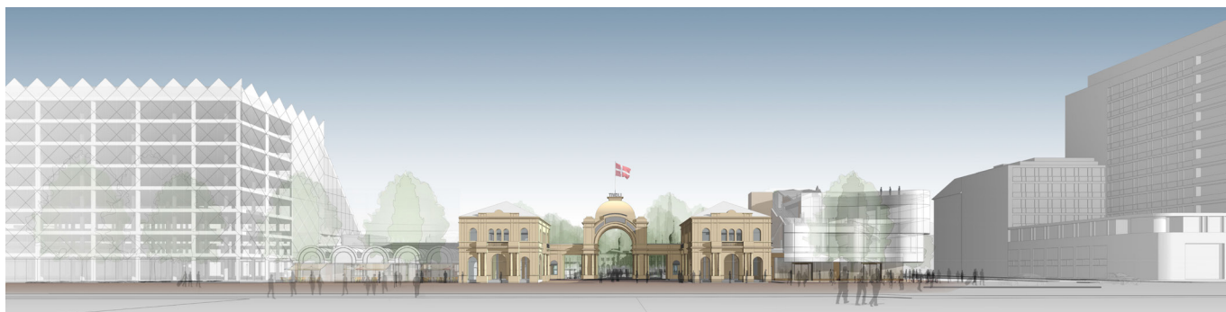
Projektet mod Vesterbrogade, hvor det alene er hjørnebebyggelsen, der er opført. Tivoli har oplyst, at de ønsker at starte med hjørnebebyggelsen, mens bebyggelsen mellem Industriens Hus og hovedindgangen først vil blive bygget i en senere fase. Ill. Pei Cobb Freed & Partners.