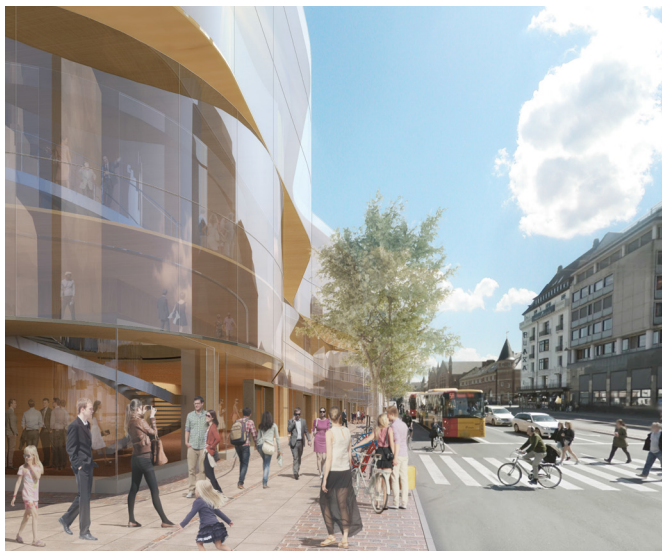
Projektet langs Bernstorffsgade, hvor fodgængerarealet er udvidet ved tilbagetrækningen af stueetagen, og den bølgede glasfacade krager ud over stueetagen og fortovet. Der placeres nye træer og cykelstativer. Ill. Pei Cobb Freed & Partners.

Mod Tivolihaven forholder facaden sig til det tilknyttede haverum, og refererer med sine terrasser til Tivolis øvrige scener.