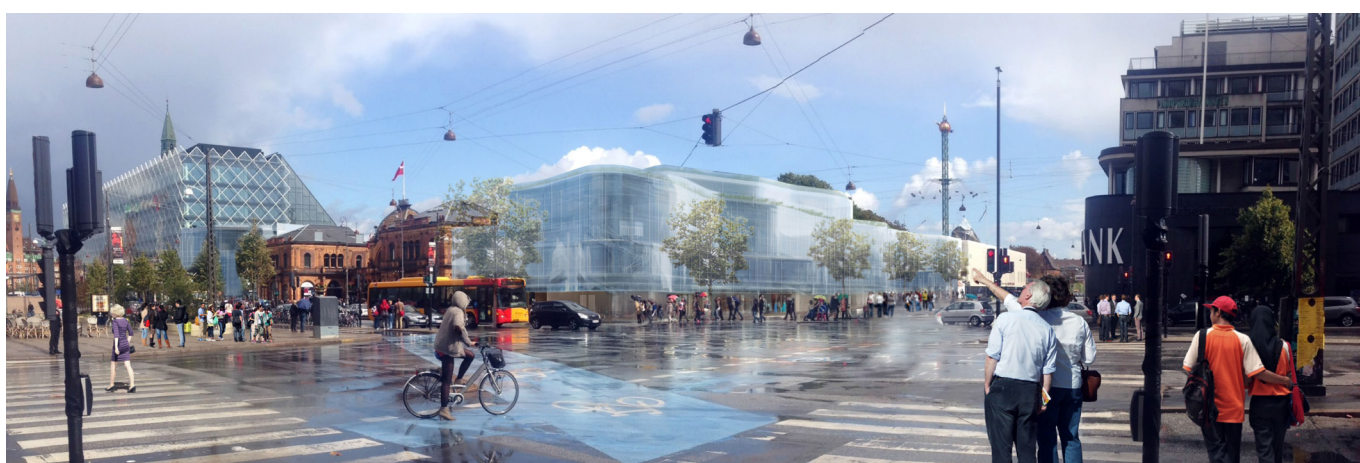
Projektet set fra hjørnet af Vesterbrogade og Hammerichsgade. Ill. Pei Cobb Freed & Partners.