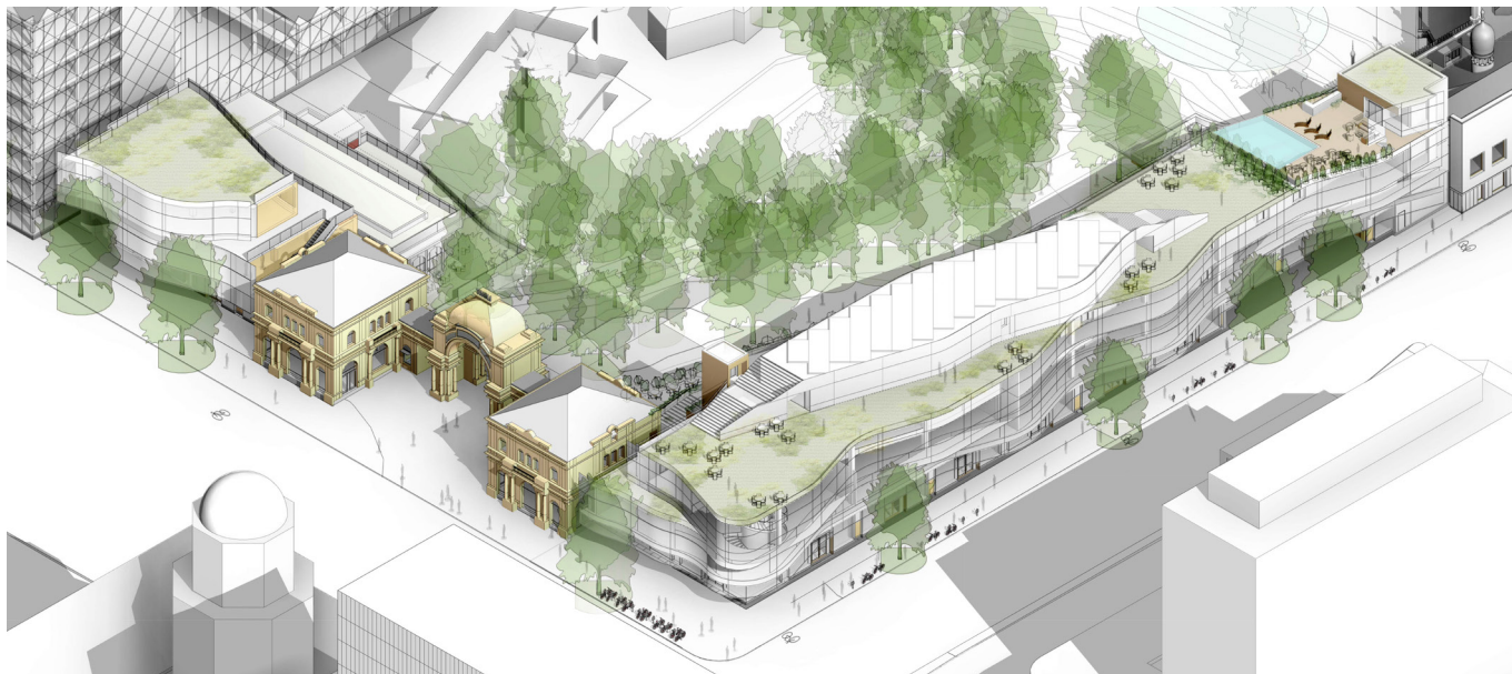
Projektet set fra luften mod Vesterbrogade og Bernstorffsgade. Taghaven begrønnes og der placeres solceller på tagetagen. Ill. Pei Cobb Freed & Partners .

det omkring Rådhuspladsen og Vesterbrogade er præget af serviceerhverv, butikker, biografer og restaurationer, og der er liv en stor del af døgnet.