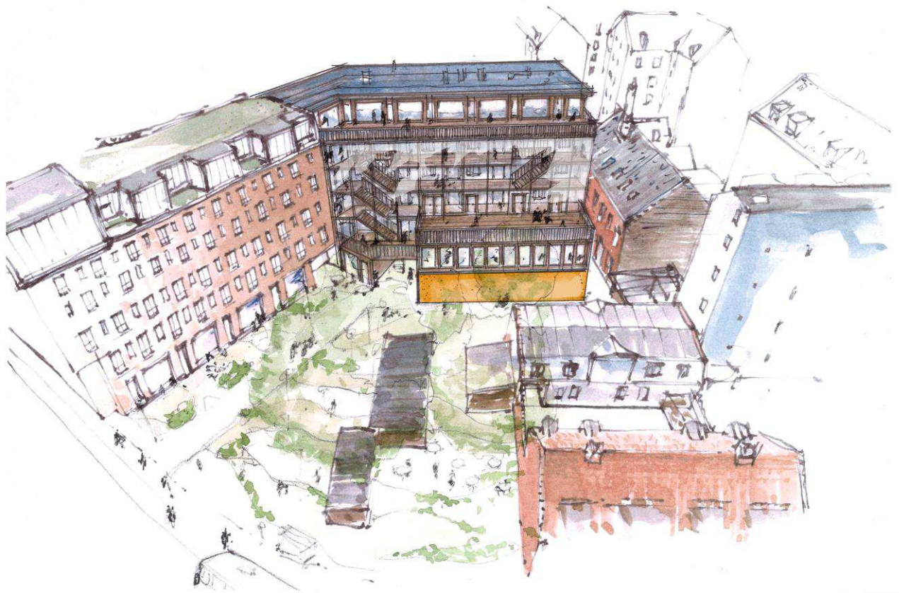
Det nye Rytmisk Center og pladsen mod Enghavevej