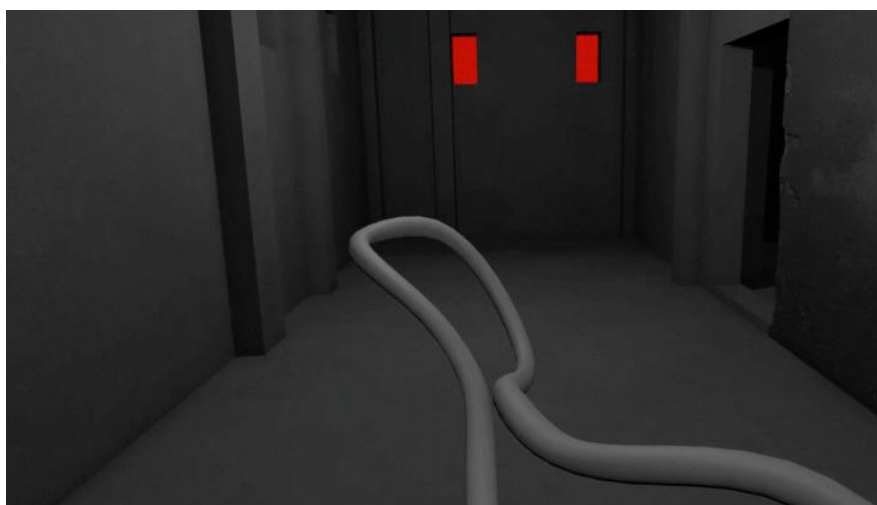
Still fra VR-værket 'Dispatched' af Sophie Hjerl.

En etage længere nede ligger det fantastiske udstillingsrum. De sorte aftegninger på de grå og patinerede vægge viser, hvor højt vandet stod i det rum, der engang var vandbeholder.