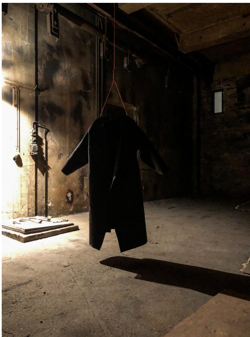
En dobbelttydig sort kæmpefrakke hænger fra loftet – præstekappe eller computerspiltøj?