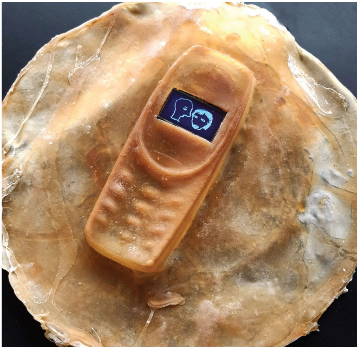
Dumb Phones, 2020. Gummiafstøbninger af telefoner med skærme. Naturgummi, akryl, elektronik. 28 (Ø) x 3 cm (hver del)