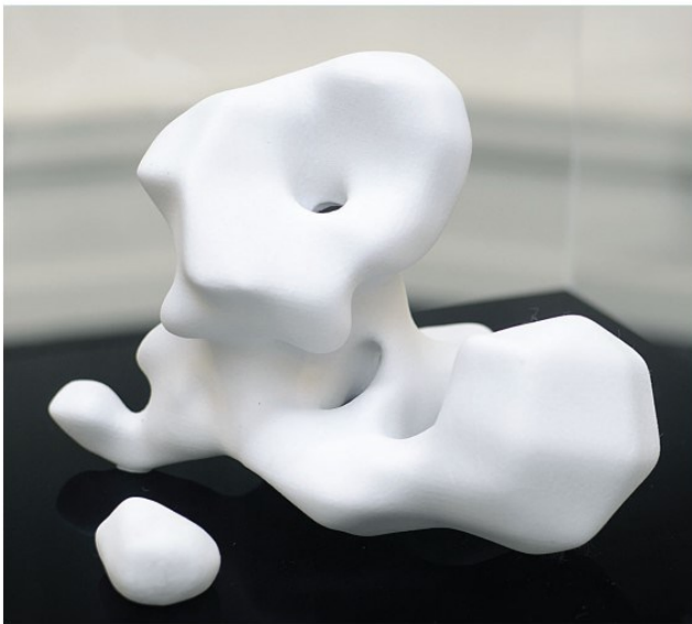
The File Room 2017. 10 stk gipsprint efter server-data. Hver ca. 25 cm x 25 cm x 25 cm.