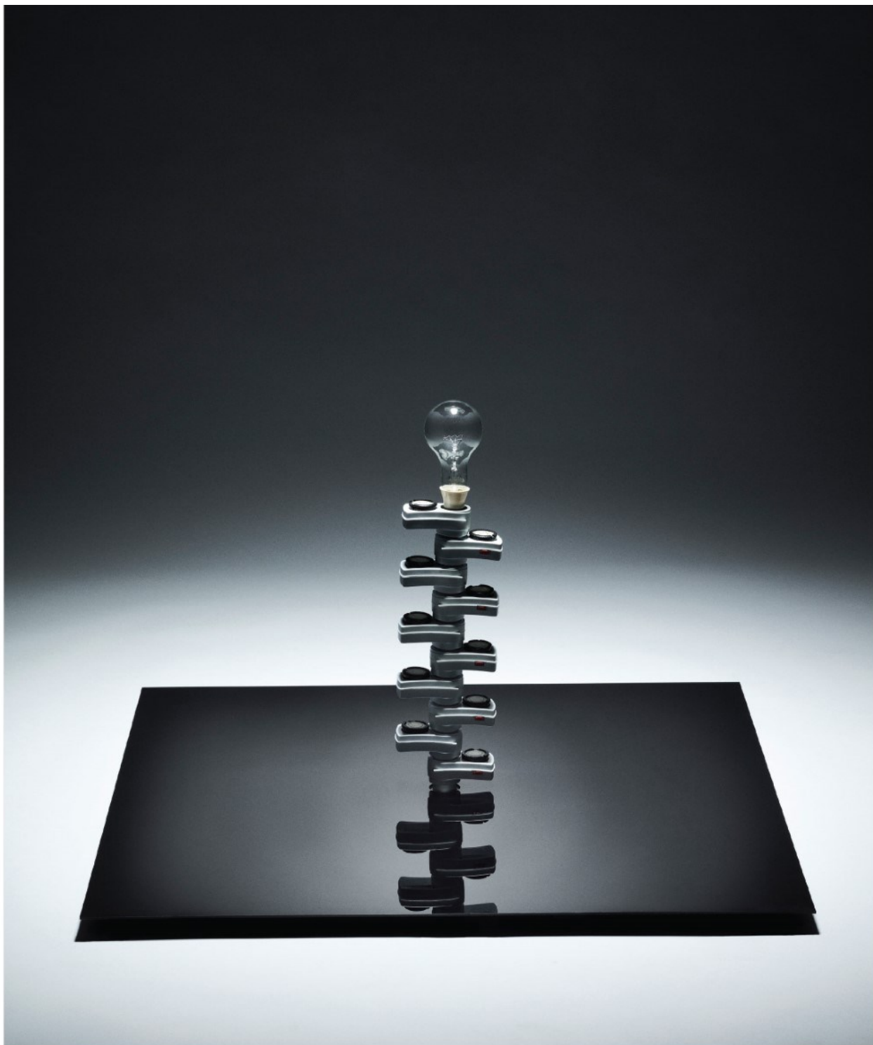
Who Cares What It Does, 2012. Glødelampe, serieforbundne tænd-og-sluk urer. 100 cm x 100 cm x 60 cm.