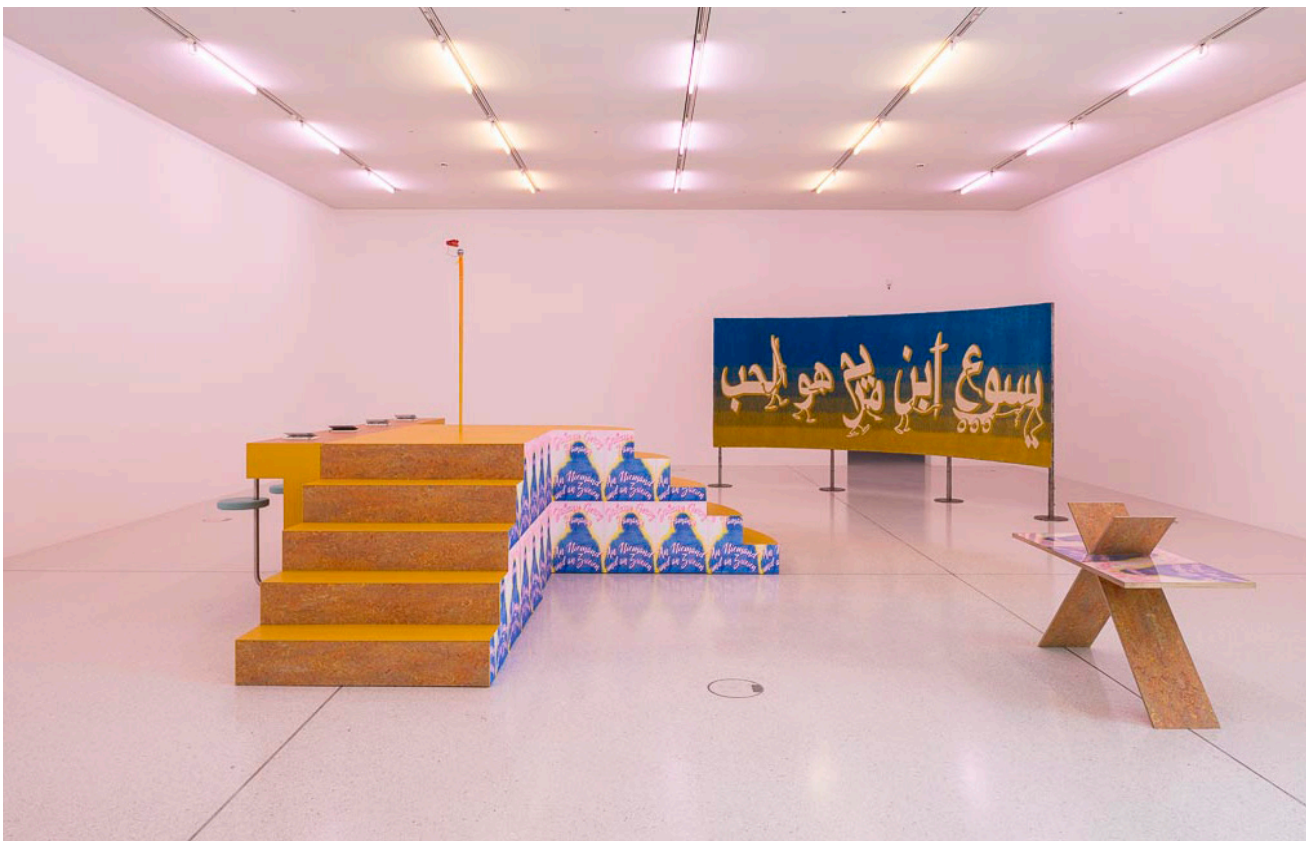
Foto: Slavs and Tatar. Wesrfalischer Kunstverein. 2018

Annual Reportt vil invitere den polsk-iranske duo Slavs and Tatars til at give en kunstnerisk præsentation i Annual Reportts udstillingslokaler. Annual Reportt og Slavs and Tatars arbejder begge med at bruge sprog og design til en kritisk undersøgelse af forskellige former for visuel og kulturel produktion.