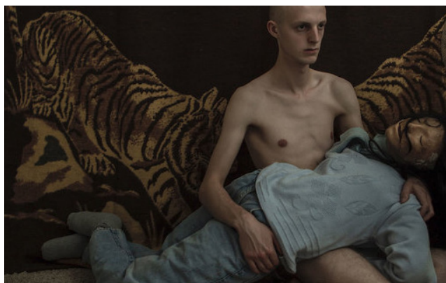
Playthings. 2019