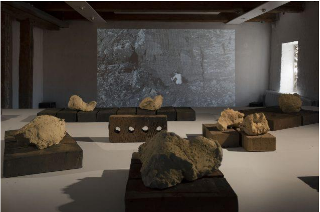
Nana Francisca Schottländer: Ex Luto. Landskabninger , SMK Thy, 2019.