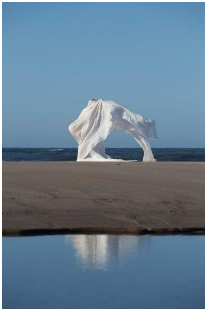
Nana Francisca Schottländer: Vindlegeme. Landskabninger , SMK Thy, 2019.