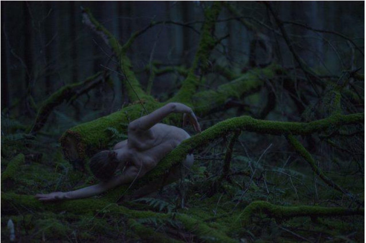
Nana Francisca Schottländer: Silkeborg Vesterskov og Slåensø IV. 8.10.19. Vandlegeme , 2020.