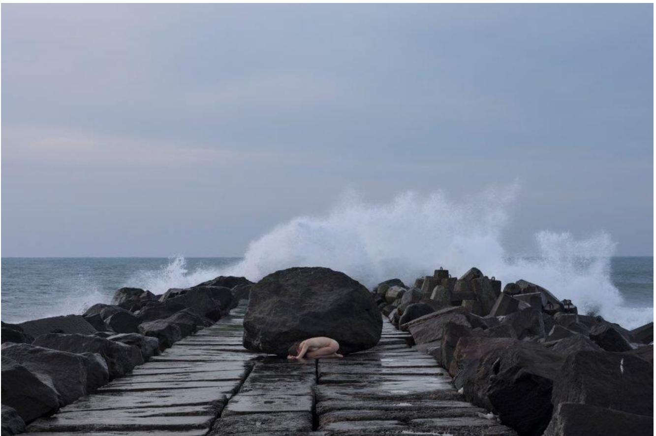
Nana Francisca Schottländer: Tre kroppe. Landskabninger , SMK Thy, 2019.