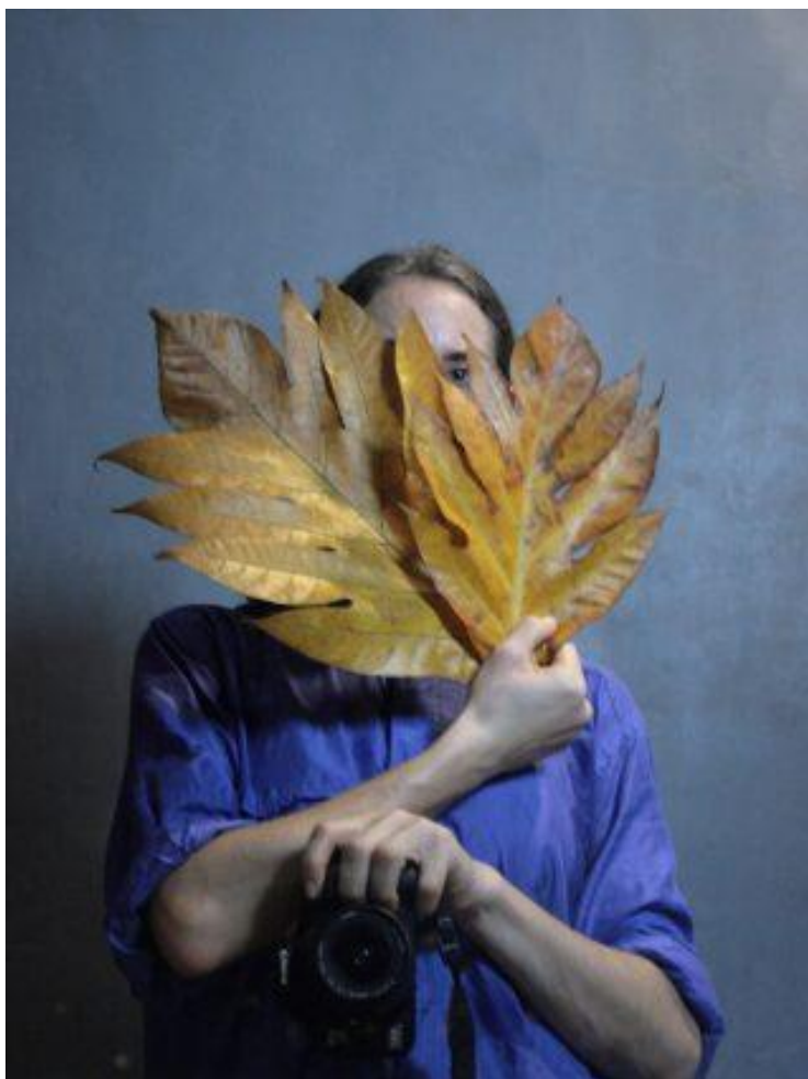
Nana Francisca Schottländer

Performance- og billedkunstner Nana Francisca Schottländer arbejder med hybrider i krydsfeltet mellem dans, performance og installations- og konceptkunst. Hun arbejder både alene, i samarbejder og tværfagligt. Hendes arbejdsfelt er undersøgende og stedspecifikt og altid med udgangspunkt i kroppen som redskab og materiale.