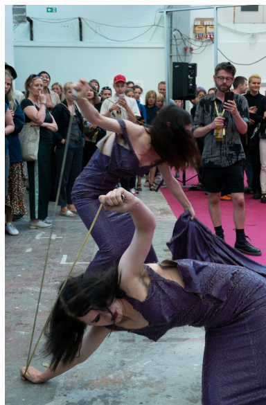
New Noveta, Mauve Maenad . Alt_Cph, 2018.

Traditionen for fladt hierarki på den selvorganiserede scene har de dog holdt i hævd og de inviterede udstillingssteder, platforme og kollektiver har bidraget med performanceværker til det samlede program. Og måske var det blandingen af cool top-down styring og demokratisk medkuratering fra feltet, der bidrog til en særlig «københavnsk stemning», som man kunne høre omtalt fra flere sider i løbet af weekenden. Den lidt foreningsagtige tilgang til tingene, som der kan være på en mindre kunstscene.