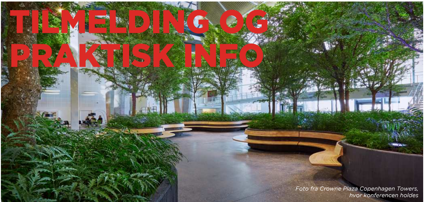
Foto fra Crowne Plaza Copenhagen Towers, hvor konferencen holdes