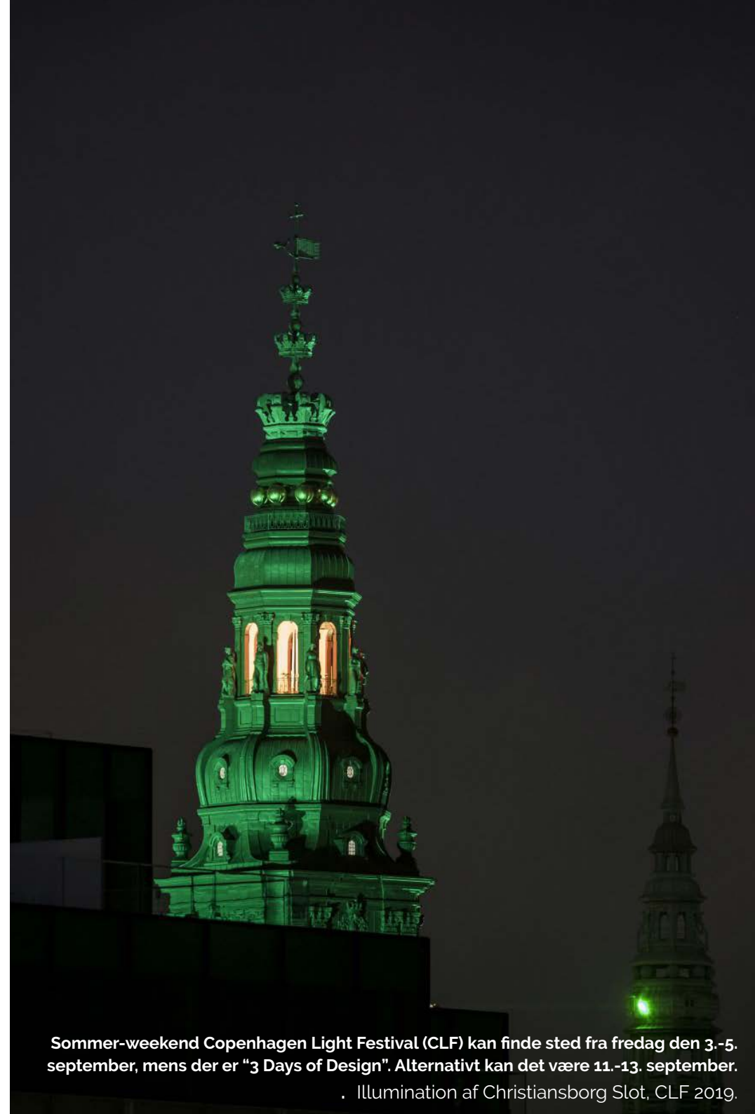
Sommer-weekend Copenhagen Light Festival (CLF) kan finde sted fra fredag den 3.-5. september, mens der er "3 Days of Design". Alternativt kan det være 11.-13. september.

En kvalitet ved Sommerweekend lysfestivalen er også, at den ikke kræver at folk samles tæt om f.eks. en bygning for at kunne se det, som de ville gøre det om f.eks. en scene. Lys kan ses på lang afstand og fra mange vinkler.