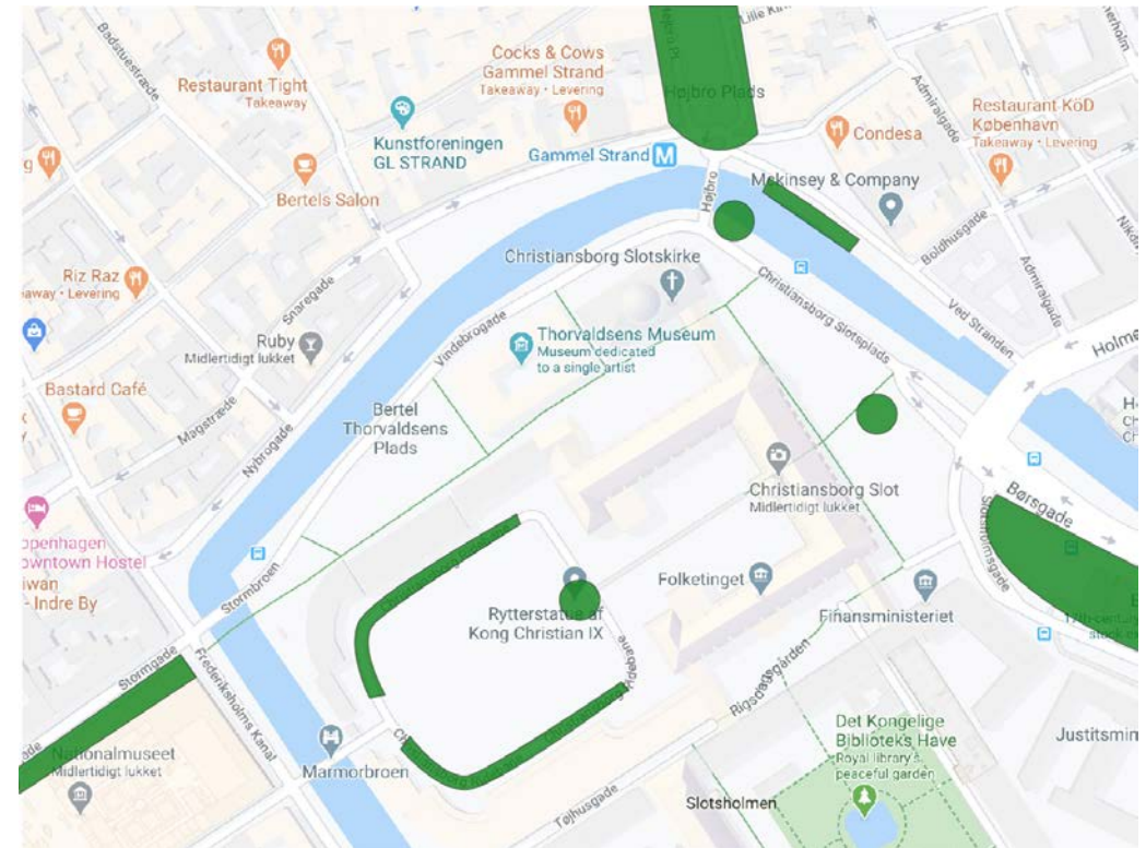
2 mindre model