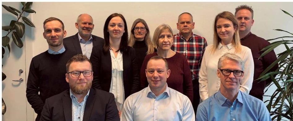
Intern Revision, Finansielt Team og Team Særlige Undersøgelser