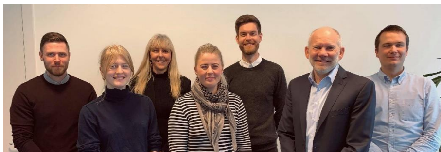
Databeskyttelsesrådgiveren, DPOKK Team og DPOSI Team