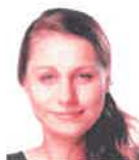
Sisse Marie Welling SOCIALISTISK FOLKEPARTI