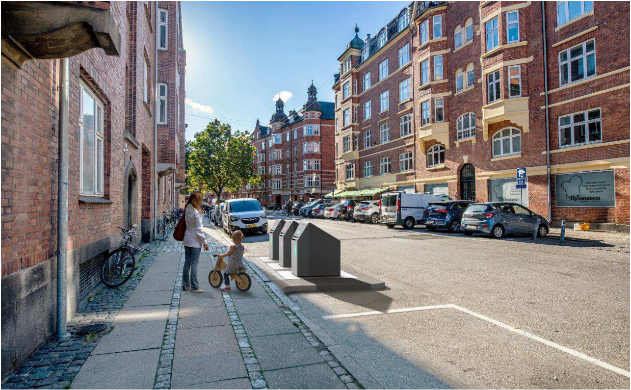
Eksempel på sorteringspunkt med tre nedgravede beholdere. Placering samt udformning af affaldsløsninger og anlæg er ikke nøjagtig gengivelse af hvordan et sorteringspunkt kommer til at fremstå.