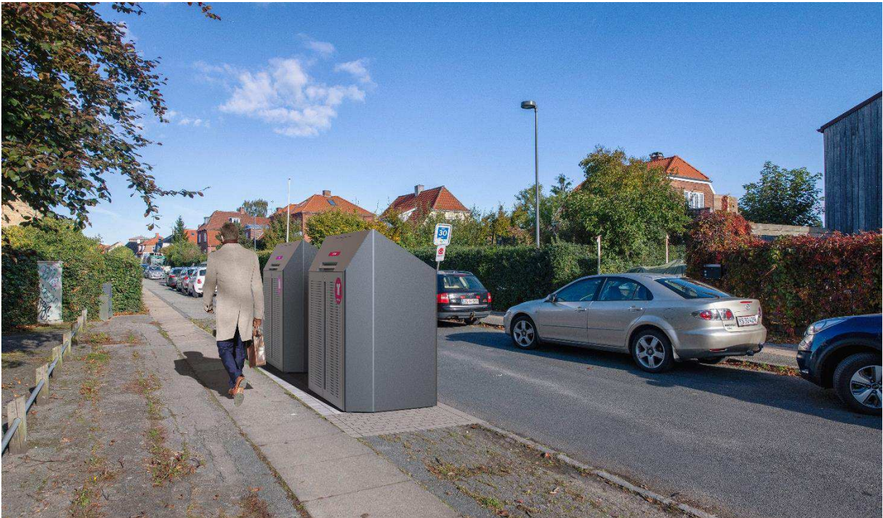
Eksempel på sorteringspunkt med to skjul. Placering samt udformning af affaldsløsninger og anlæg er ikke nøjagtig gengivelse af, hvordan et sorteringspunkt kommer til at fremstå.