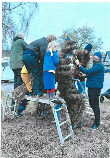
Procesbillede fra SEA skulptur ved Italiensvej og Amager Strand, hvor beboere brugte den traditionelle tænge-metode til at beklæde skulpturen med ålegræs.