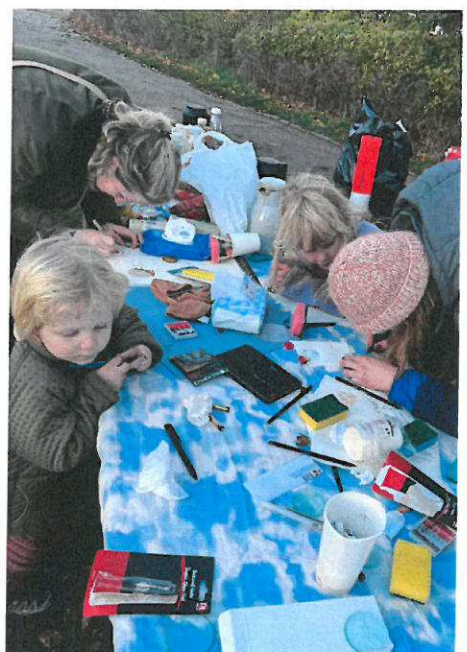
Procesbillede fra SKY skulptur ved Englandsparken, hvor beboere lavede kikkerter, hvor linserne blev graveret med motiver fra parken. Kikkerterne blev efterfølgende sat ind i skulpturen.