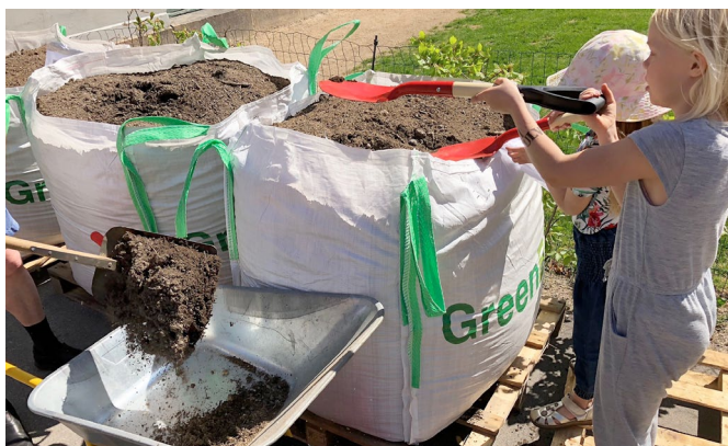
Østerbro Madhaver: Opstarts-workshop om spiselige planter og sparring med lokale ildsjæle, der er ophavspersoner til projektet.