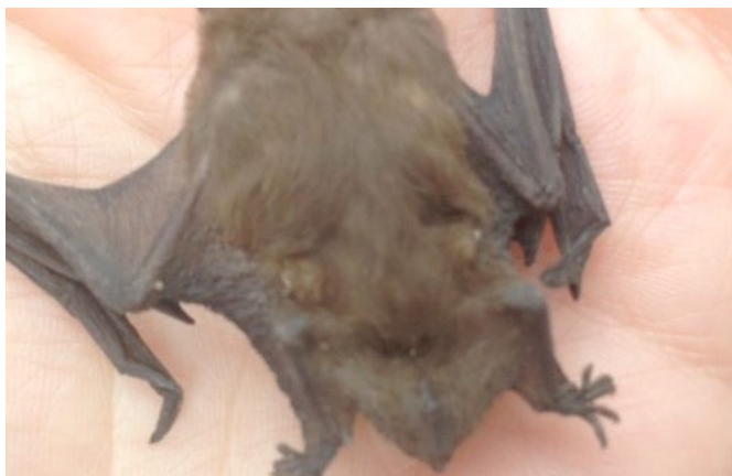
Flagermusture. Miljøpunkt har fortsat med at afholde de populære flagermusture i Fælledparken. I samarbejde med Danmarks Naturfredningsforening.