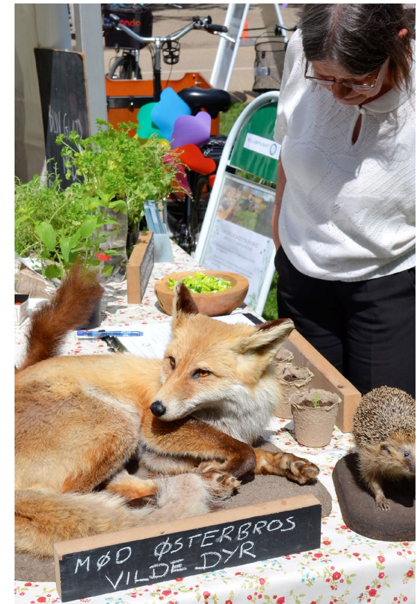
Fokus på bynatur til Østerbroweekend. I samarbejde med Østerbro Lokaludvalg.

Miljøpunkt Østerbro fortsætter med at udlåne de populære ladcykler, lånehøns, samt et æblemosteri. Vores ladcykler tæller nu en park på tre cykler. Låneordningen er meget populære og cyklerne bruges til alt fra flytning til polterabend eller til blot at afprøve en ladcykel, inden man selv beslutter sig for et køb. Miljøpunkt Østerbros Lånehøns går ud på at borgerne kan prøve at holde høns i 3 måneder.