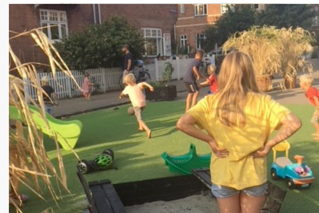
Sommerpark i Lyngbyvejskvarteret: Miljøpunkt har i 2018 indledt et samarbejde med Lyngbyvejskvarteret, som vi i 2019 er fuldt i gang med at udvikle.