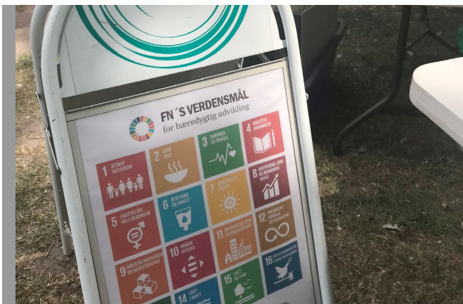
FN's verdensmål for bæredygtig udvikling: Miljøpunktet har holdt oplæg om, hvordan verdensmål bliver til hverdagsmål i forbindelse med Bæredygtigt Marked på Østerbro.