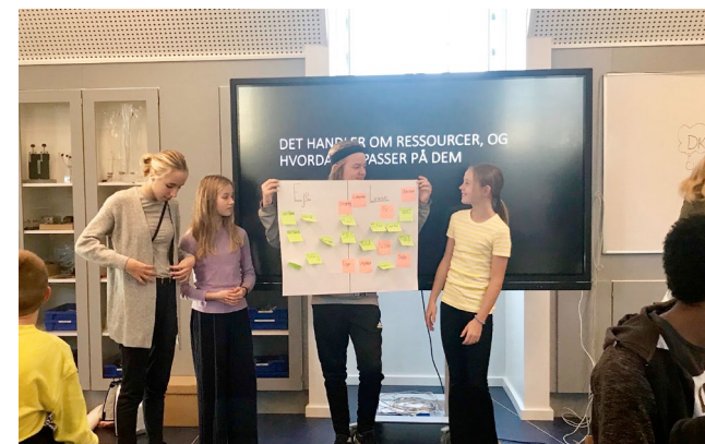
Generation Verdensborger: Elever fra Randersgade Skole præsenterer sine bud på, hvilke produkter der kan indgå i en deleøkonomi.