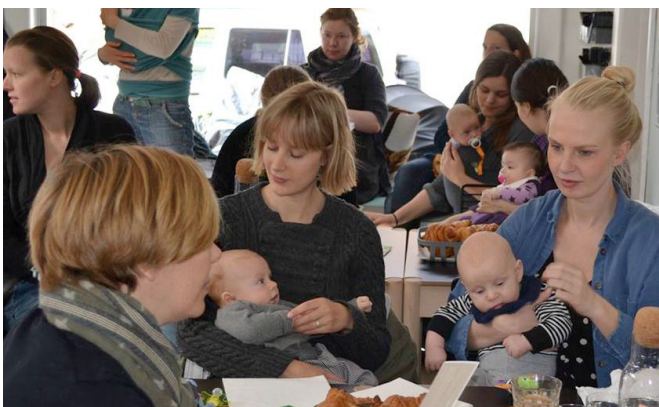
Bæredygtig barsel: Også i 2018 har Miljøpunktet rådgivet barslende forældre om, hvordan de kan undgå skadelig kemi i hverdagen, og tage bæredygtige valg som forbrugere.