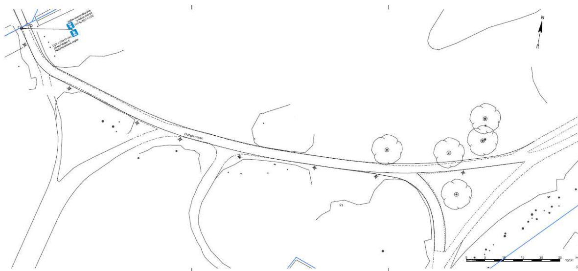
Figur 2. Stiforløbet

Mod kommunegrænsen til Gladsaxe udarbejdes en harmonisk løsning, således at stien i Gyngemosen på en harmonisk måde møder den lidt smallere og brostensbelagte sti i Gladsaxe Kommune.