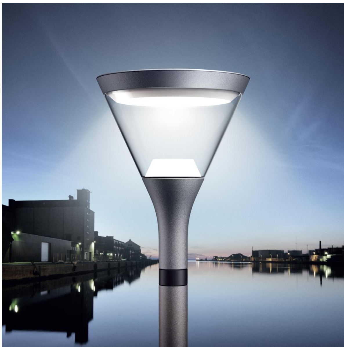
Figur 3. Focus Lighting Sky Park

Mast og armatur skal udføres i indfarvning 7024. Mast skal udføres med anti-sticker og anti-graffiti.