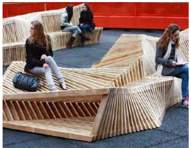
Inspiration til den fremtidige gårdhave