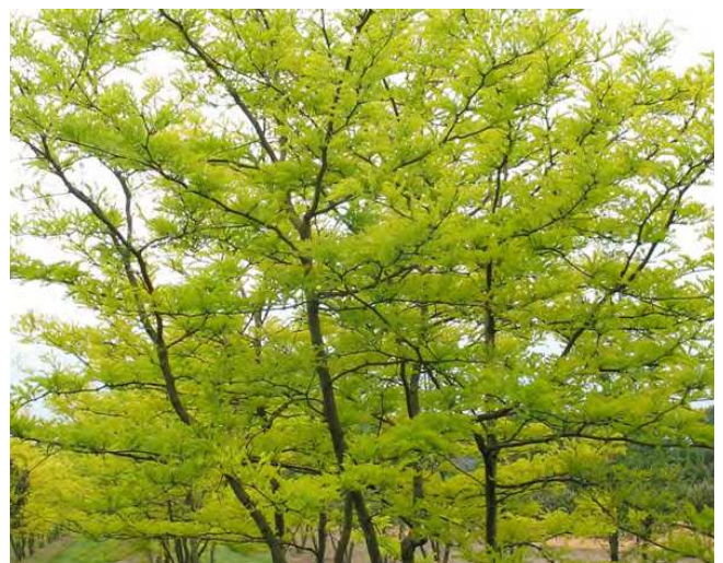
Inspiration til den fremtidige gårdhave