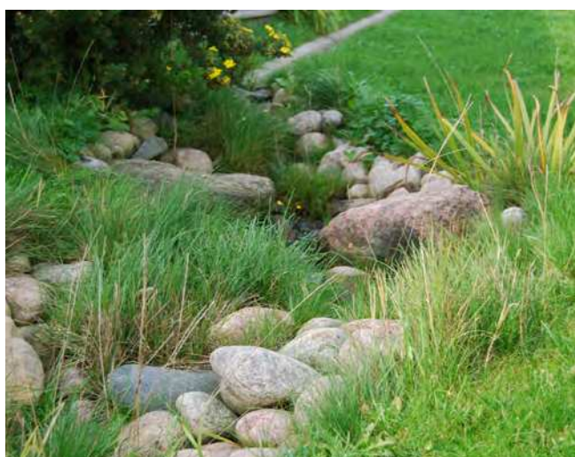
Inspiration til den fremtidige gårdhave