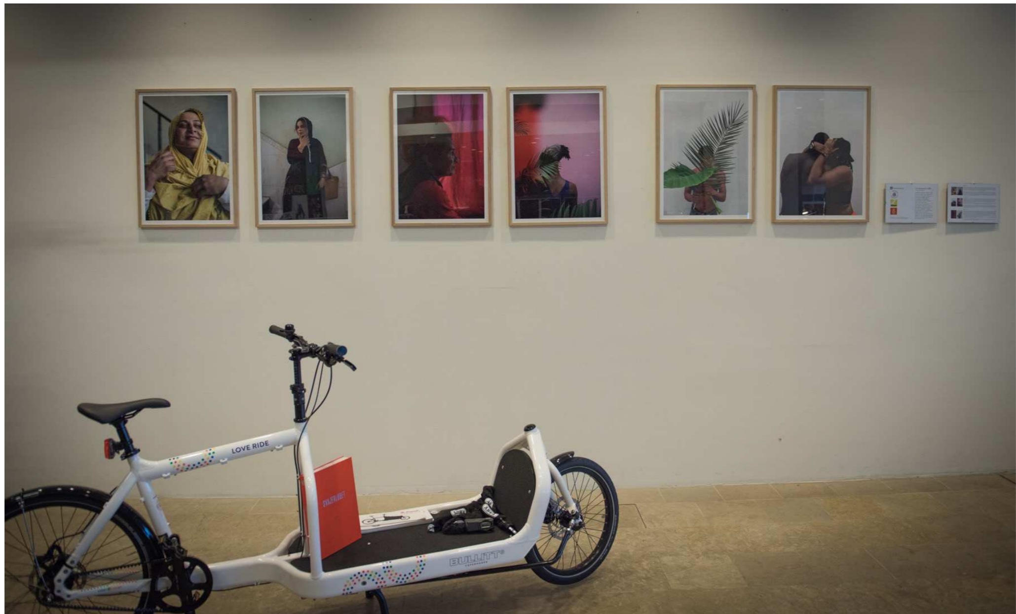
Udvalg af Loud and Proud serien på Copenhagen Pride's kontorer