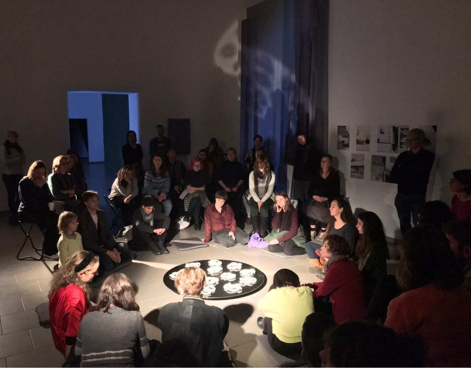
Time Travel into Dark Matter