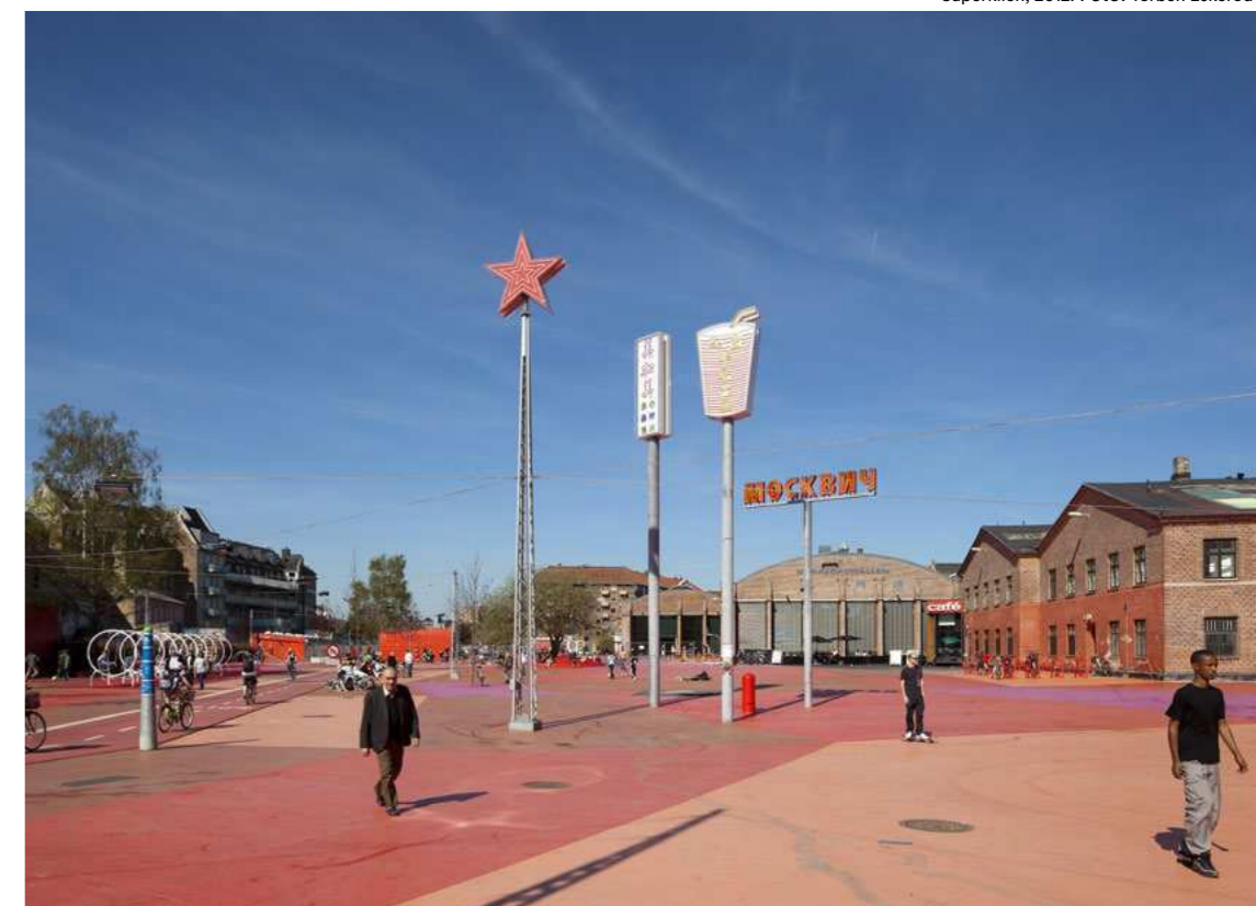
Superkilen, 2012.

“Så på den måde kan man sige, at kunsten indirekte er politisk”, slutter Jakob Fenger.