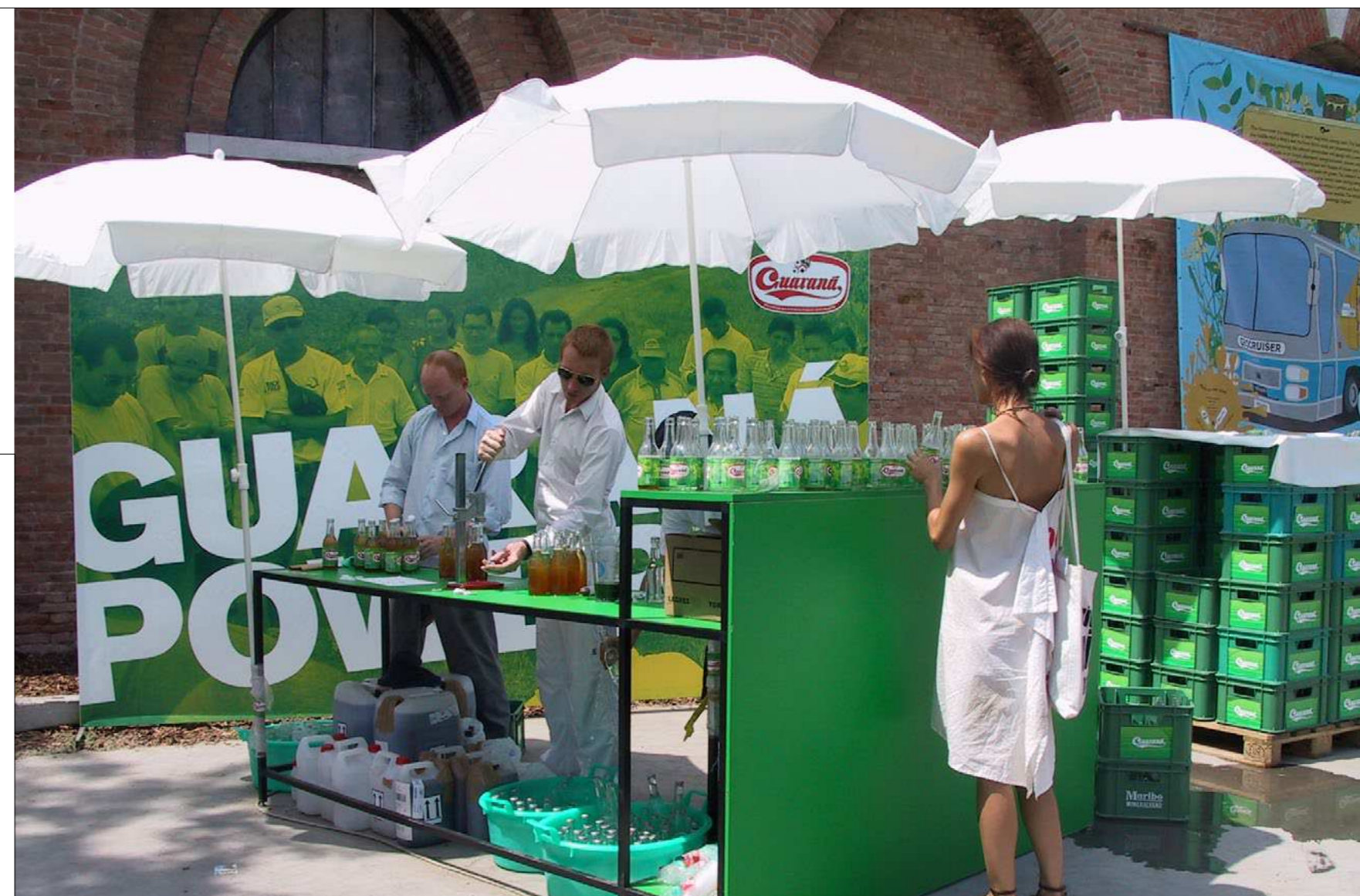
Salg af sodavanden Guaraná Power på Venedig Biennalen, 2003. Foto: Superflex

Med en kunstnerisk strategi, der ikke blot holder sig indenfor kunstmuseernes trygge og privilegerede mure insisterer SUPERFLEX på at blande blod med virkeligheden, forretningsmodellerne, den politiske aktivisme og udfordringerne af ophavsretten.