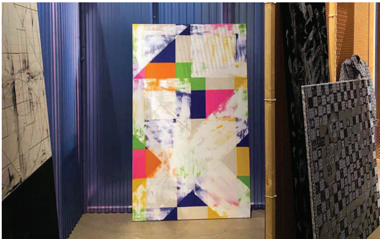
Mette Winckelmann: LAILA UTI, 2019. Installationsfoto.