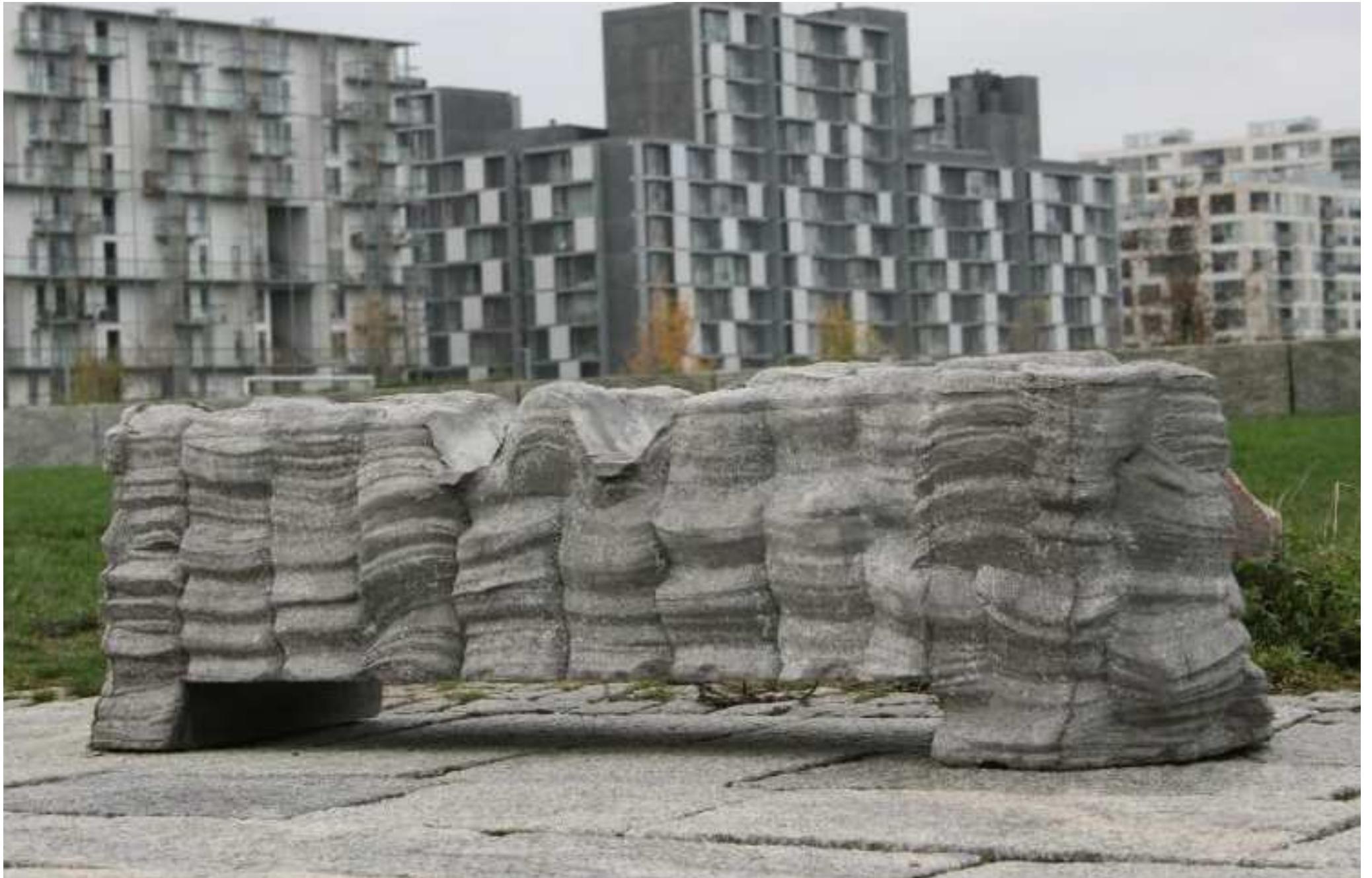
Esben Klemann, bearbejdede betonbarrierer, 2015