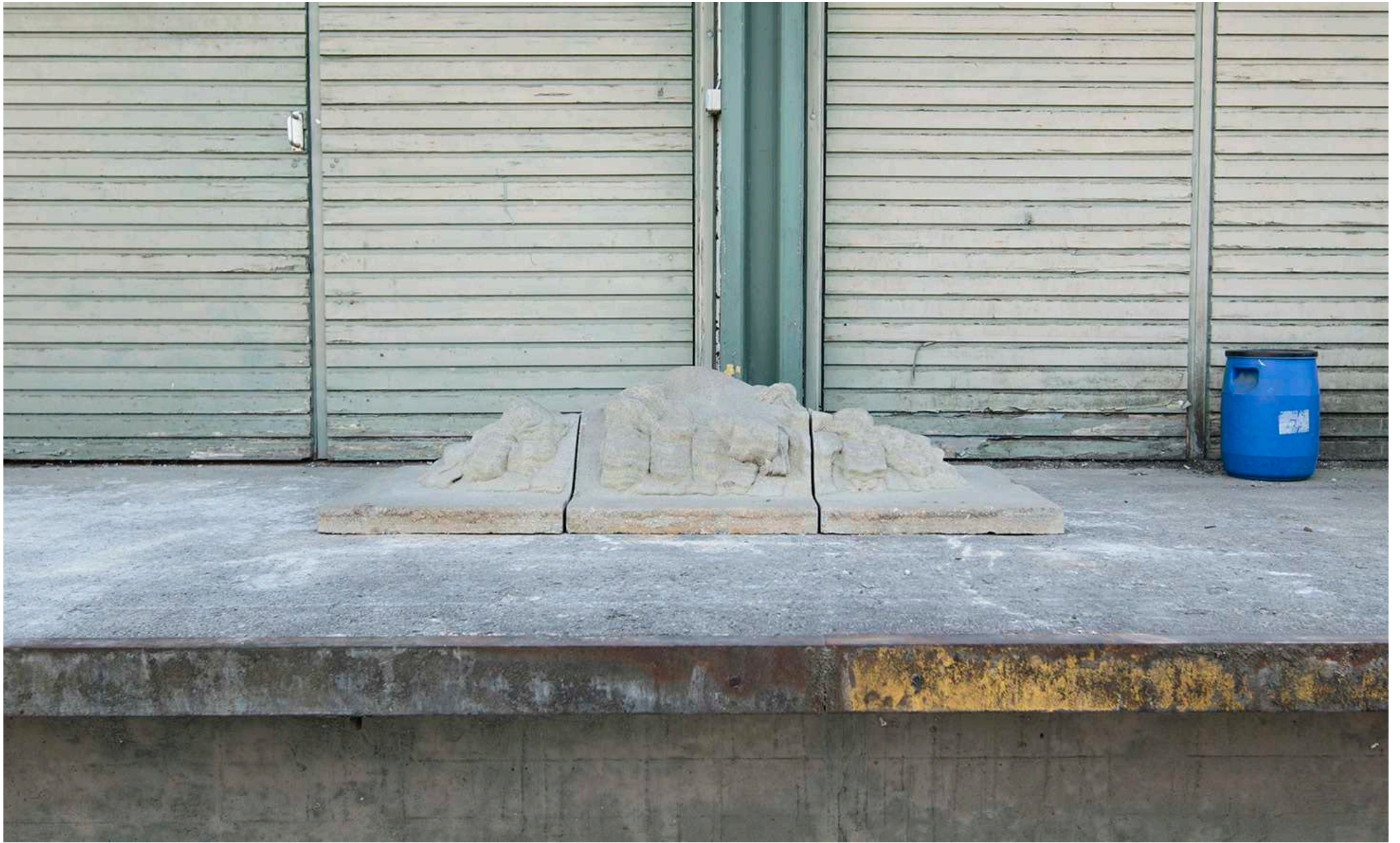
Esben Klemann, Nedsmeltning , 2010-17, fra Engros udstillingen med Skulpturi, 2017