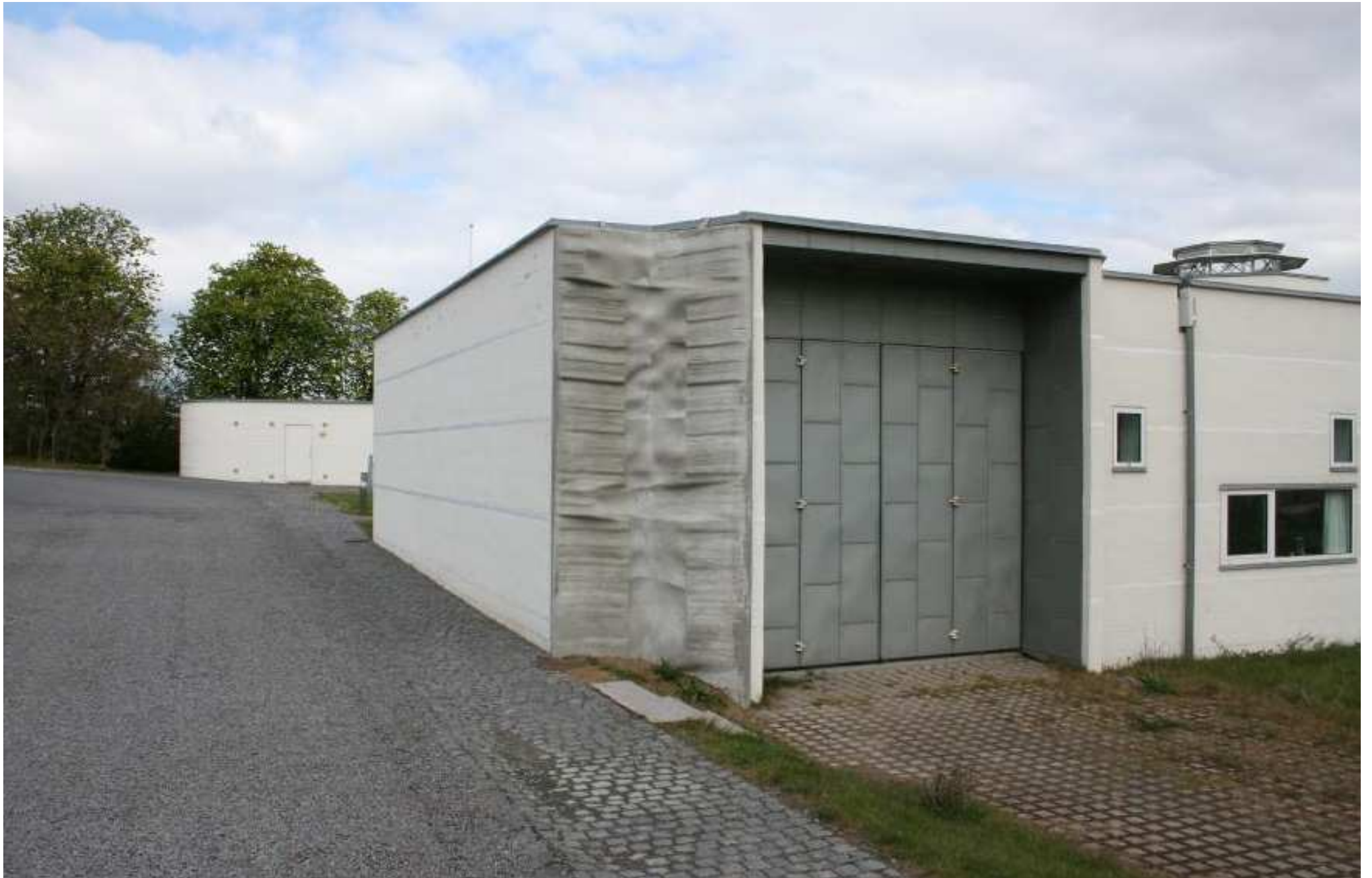
Esben Klemann, Nye genveje , 2009, Bornholms Kunstmuseum