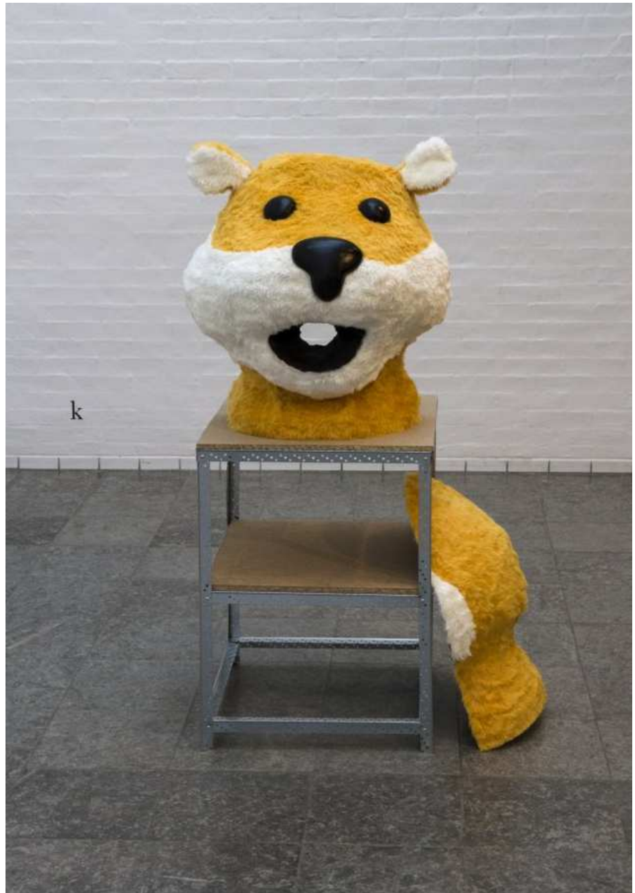
Kasper Hesselbjerg: Arkitekturmodel til mit hovede .