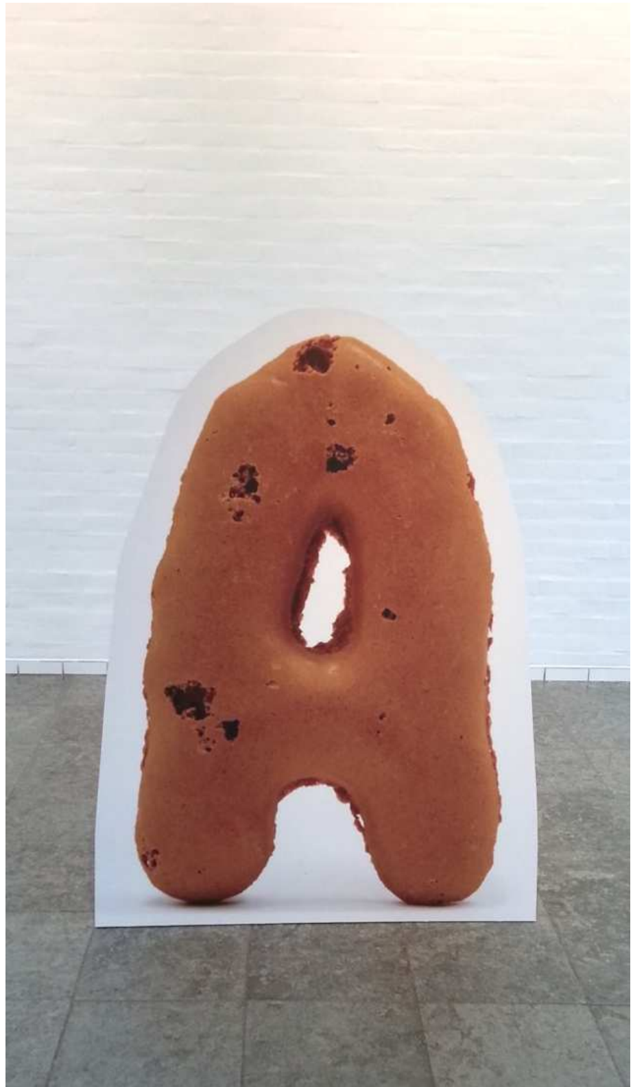
Kasper Hesselbjerg: Coco Pop A . Foto: Ole Bak Jakobsen