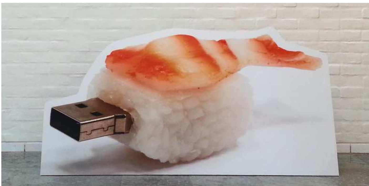
Kasper Hesselbjerg: Shrimp Usb Stick (32 GB) .

Anmeldelse 8 okt 2015 Af Ole Bak Jakobsen