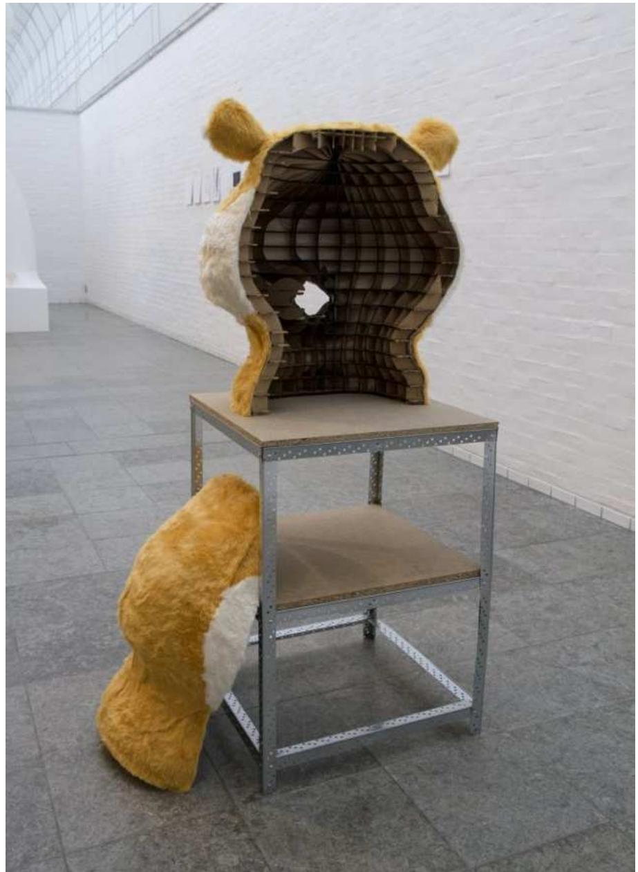
Kasper Hesselbjerg: Arkitekturmodel til mit hovede .