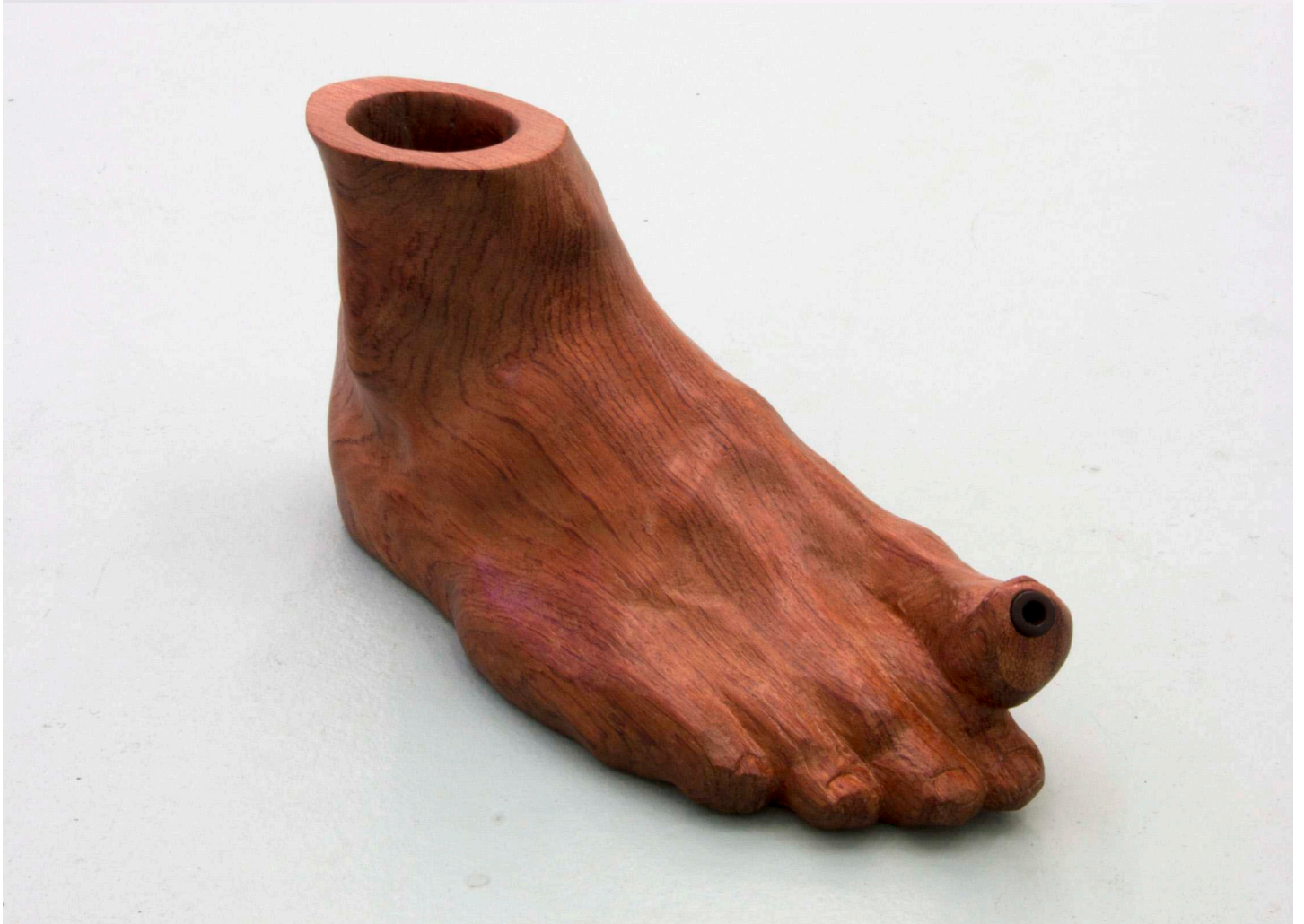
Øverst: Soft and Easy Pleasure (Ear Salad) , Muslinger, ærteskud, frisée salat, græskarkerneolie, citron og porcelæn, ca. 15 x 22 x 6 cm, 2018

Skulpturen indgik i udstillingen Lunacy , hvor flere spiselige værker kunne bestilles i udstillingsrummet.