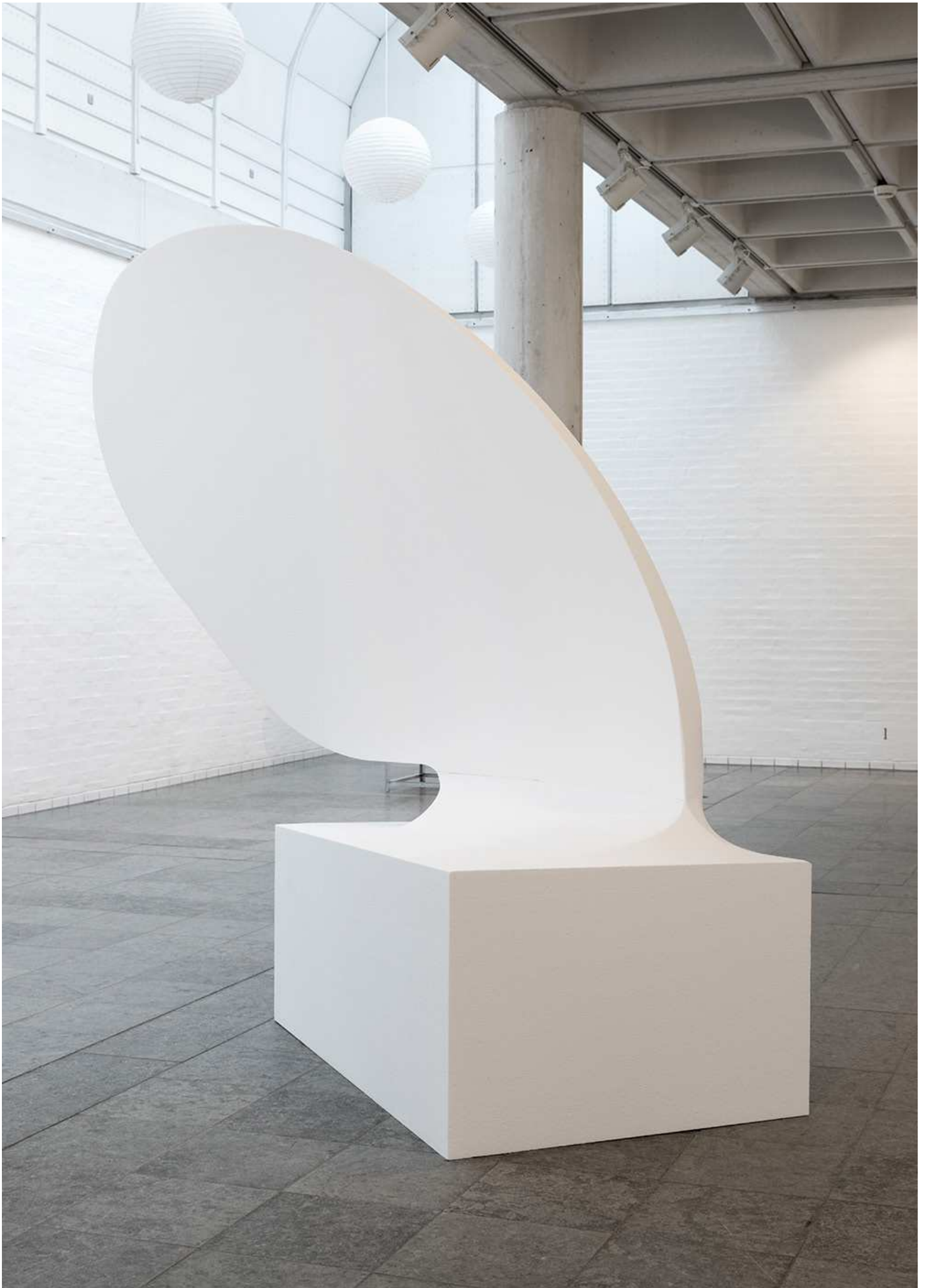
Uddrag fra "Middag i maven på en hval" , 2 stk. hvalfinner i polystyren, ca. 220 x 220 x 150 cm, 2015