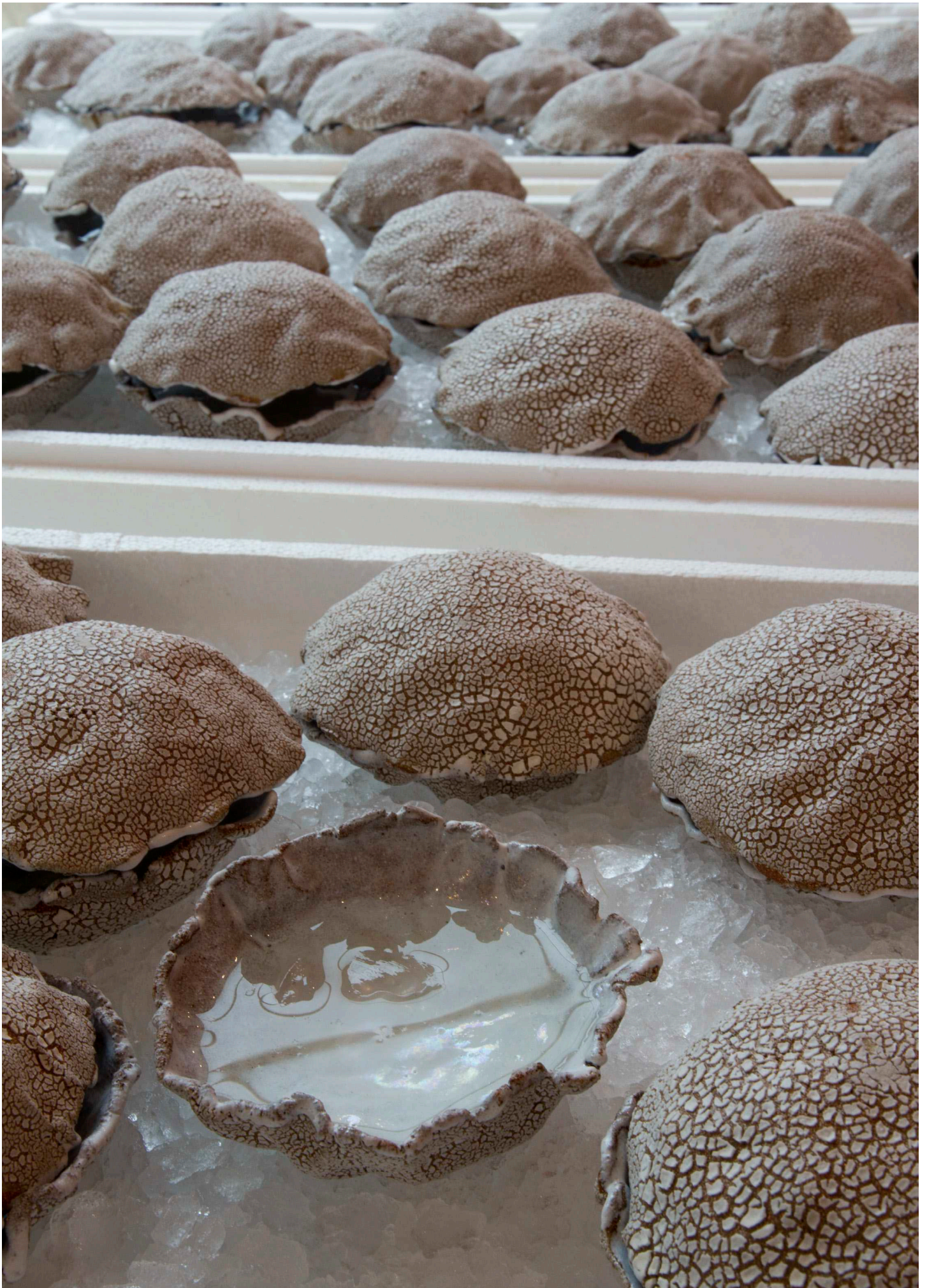
Jeg gav dem østers og lod dem vrøvle, Stentøj, oplødt vingummi, sake, knust is og flamingokasser, 90 serveringer, (Pseudo-østers eller en simulering af østersoplevelsen), Variable mål, 2016