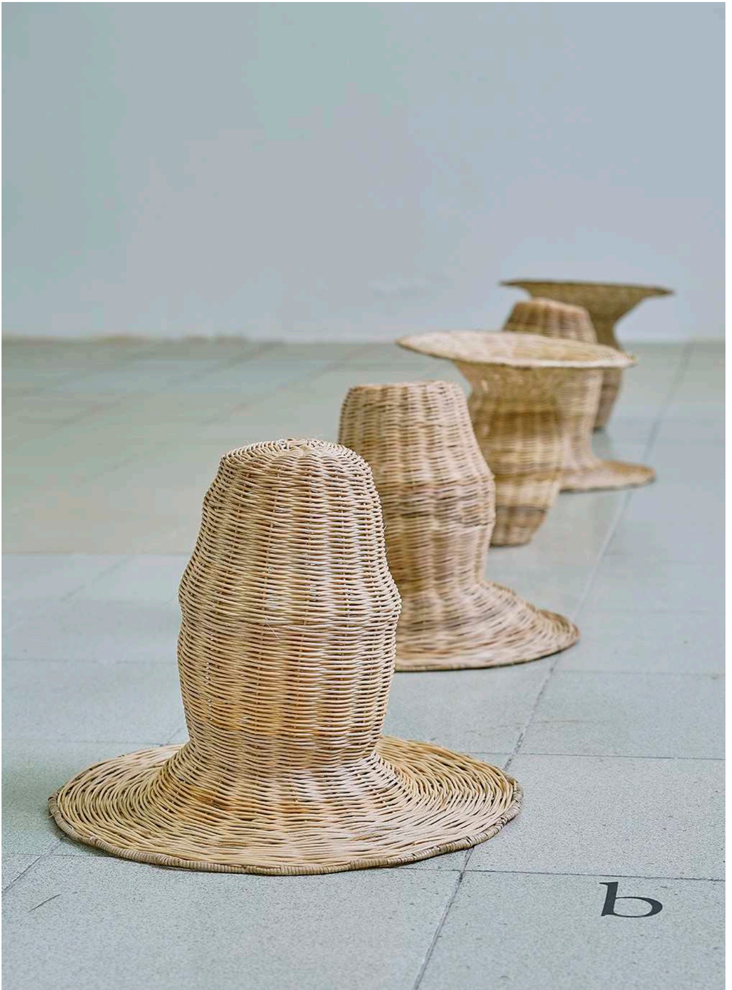
Hat, Hat, Basket, Hat, Basket , Bambus og rattan (Fem håndflettede hatte/kurve), ca. 40 x 40 x 50 cm pr. stk., 2017