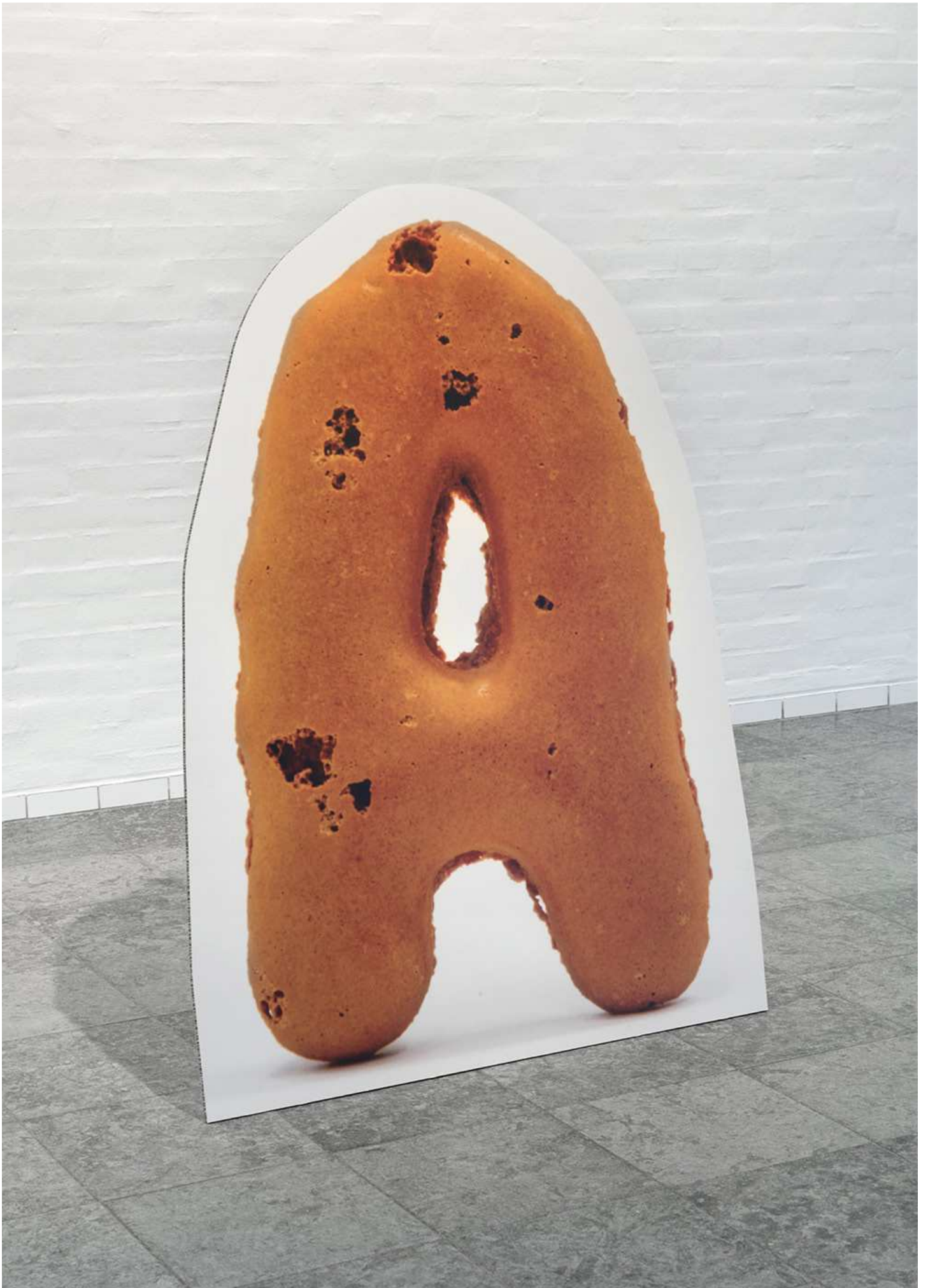
Cookie A , Print på pap, ca. 100 x 140 cm, 2015