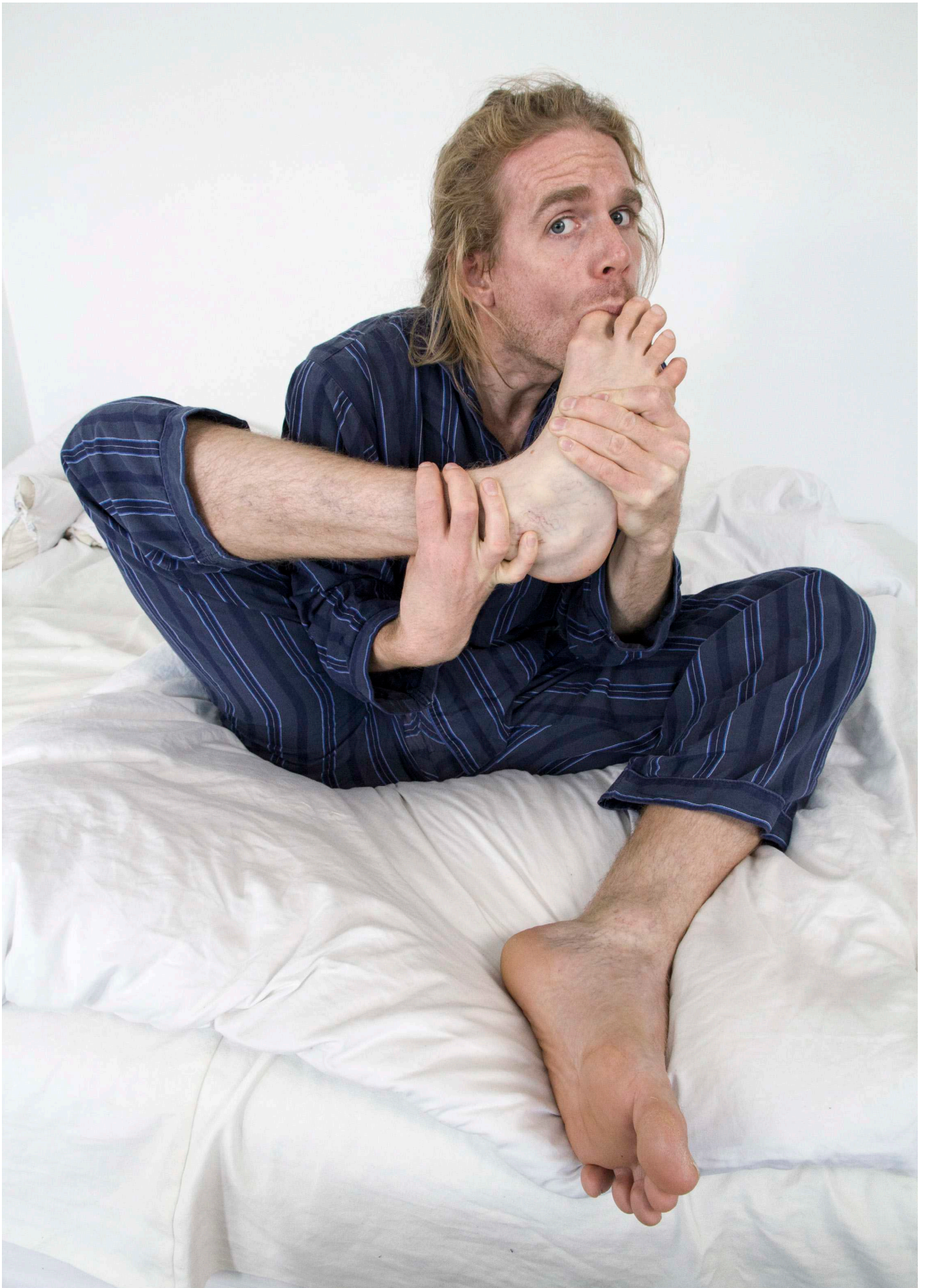
Affection (Foot) , Print på papir, 90 x 135 cm, 2017