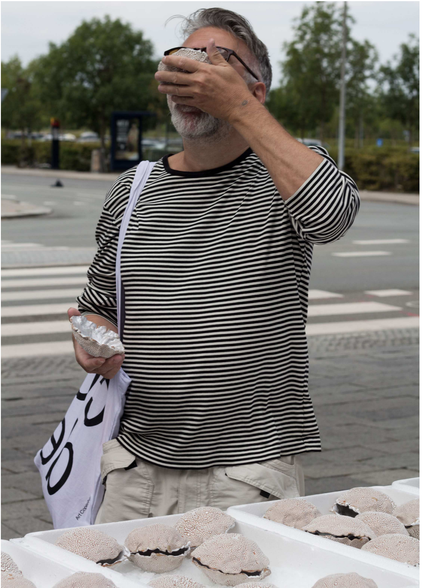
Jeg gav dem østers og lod dem vrøvle, Stentøj, opblødt vingummi, sake, knust is og flamingokasser, 90 serveringer, (Pseudo-østers eller en simulering af østersoplevelsen), Variable mål, 2016