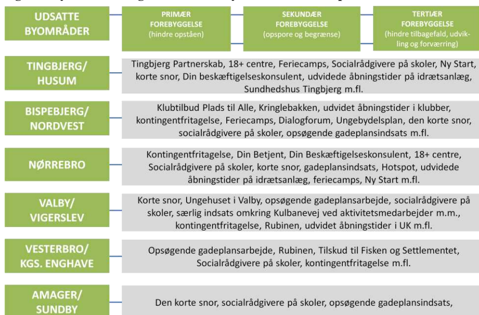
Figur 2. Systematisering efter udsatte byområder – eksempel

Hvis udgangspunktet er kommunens udsatte byområder indebærer prioriteringen at igangværende aktiviteter, som helt eller delvist er målrettet udviklingen i et bestemt byområde, rangeres i forhold til hinanden. Rangeringen baseres bl.a. på hvordan aktiviteterne understøtter kommunens overordnede målsætninger for tryghed og kriminalitet samt evt. særlige målsætninger for det pågældende område.