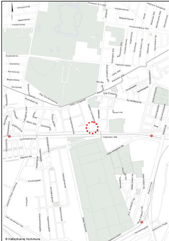
Tillægsområdet mellem Valby, Vesterbro og Kgs. Enghave