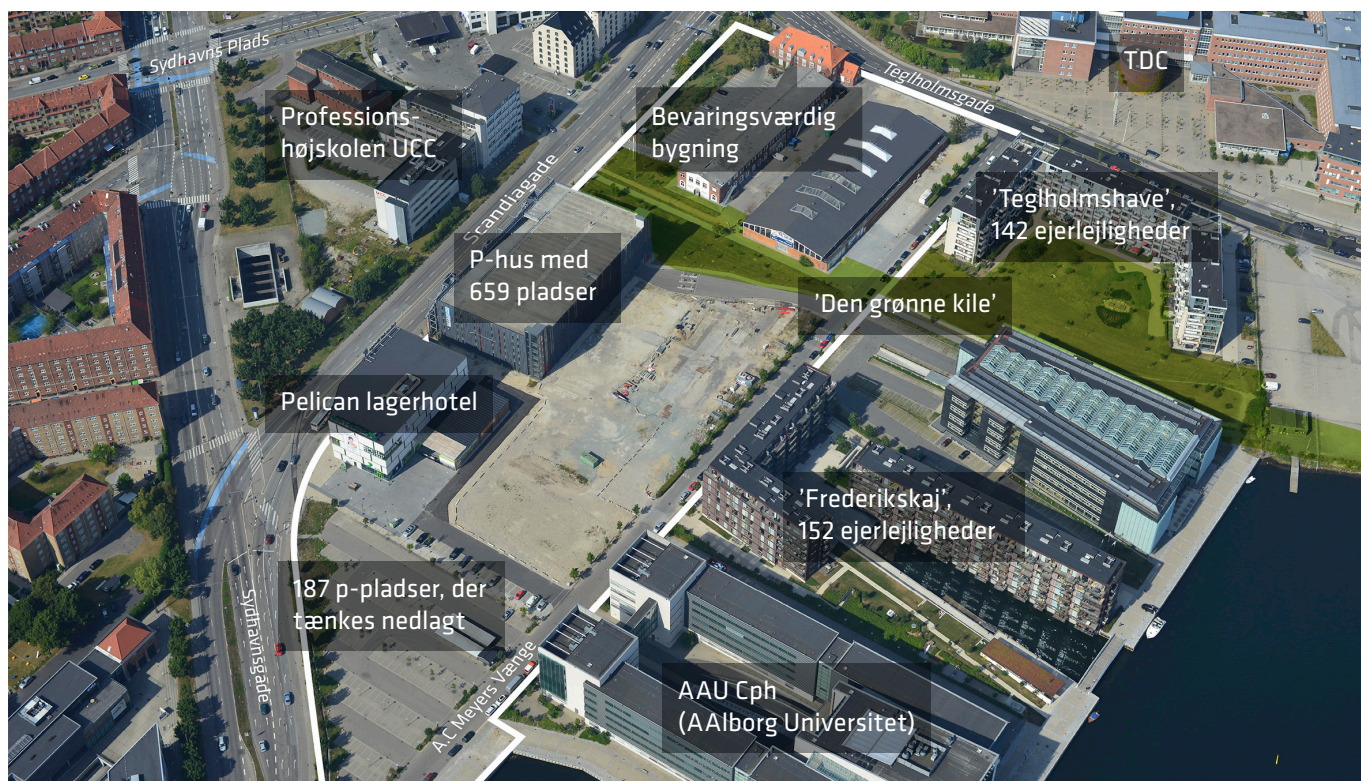
Skråfoto af tillægsområdet, 2012