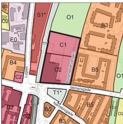
Rammer i Kommuneplan 2011