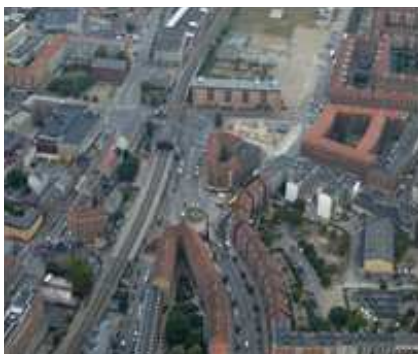
Nørrebro station set fra syd.