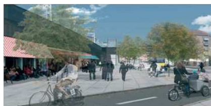
Skitse af forpladsen for den nye Nørrebro station.