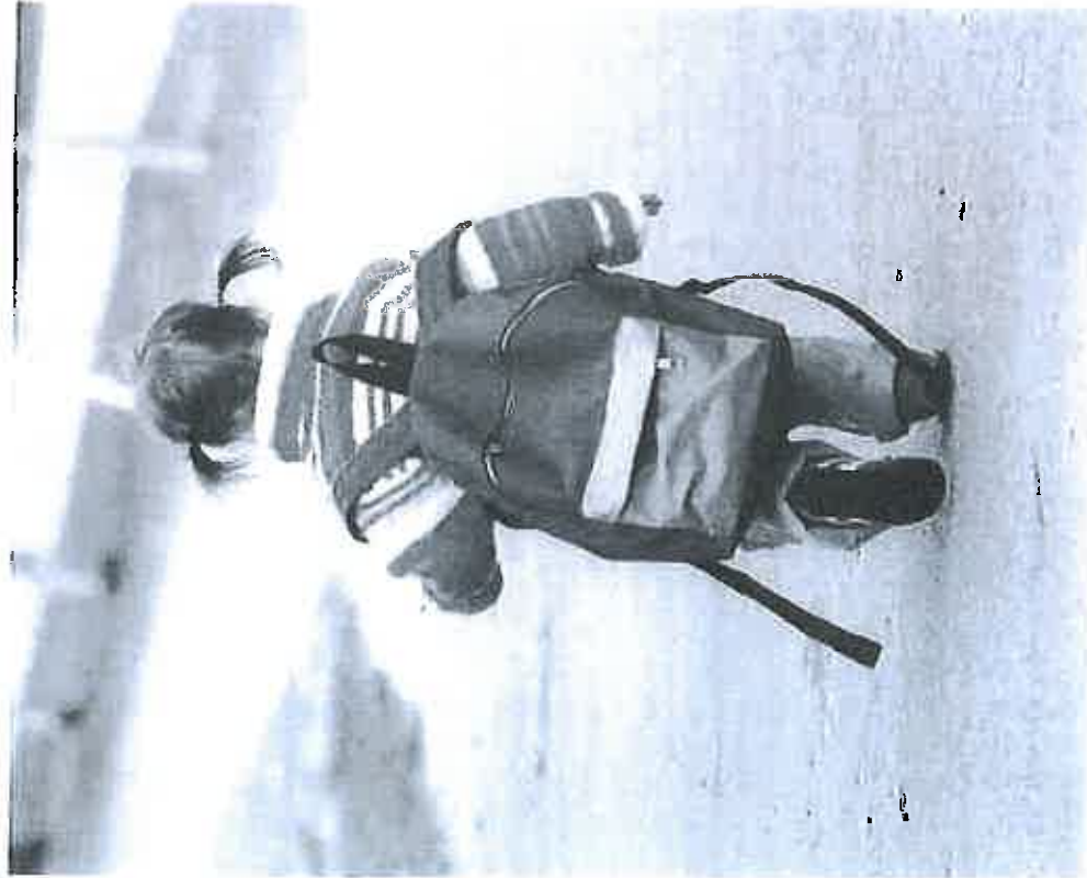
INSPIRATION TIL LIGEBEHANDLINGSEH