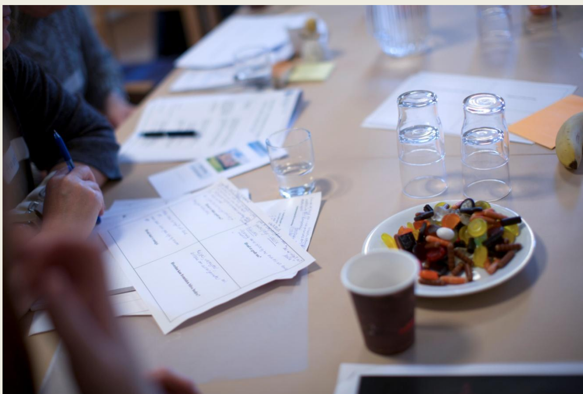
Snakken gik omkring bordene og de mange pointer og forslag blev diskuteret.