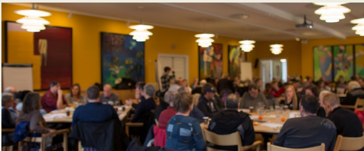
Der var fuldt hus i Store Sal på Vartov