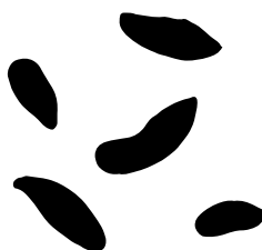
Afføring fra rotte