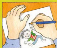
Ib Spang Olsen