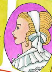
Giertrud Birgitte Bodenhoff