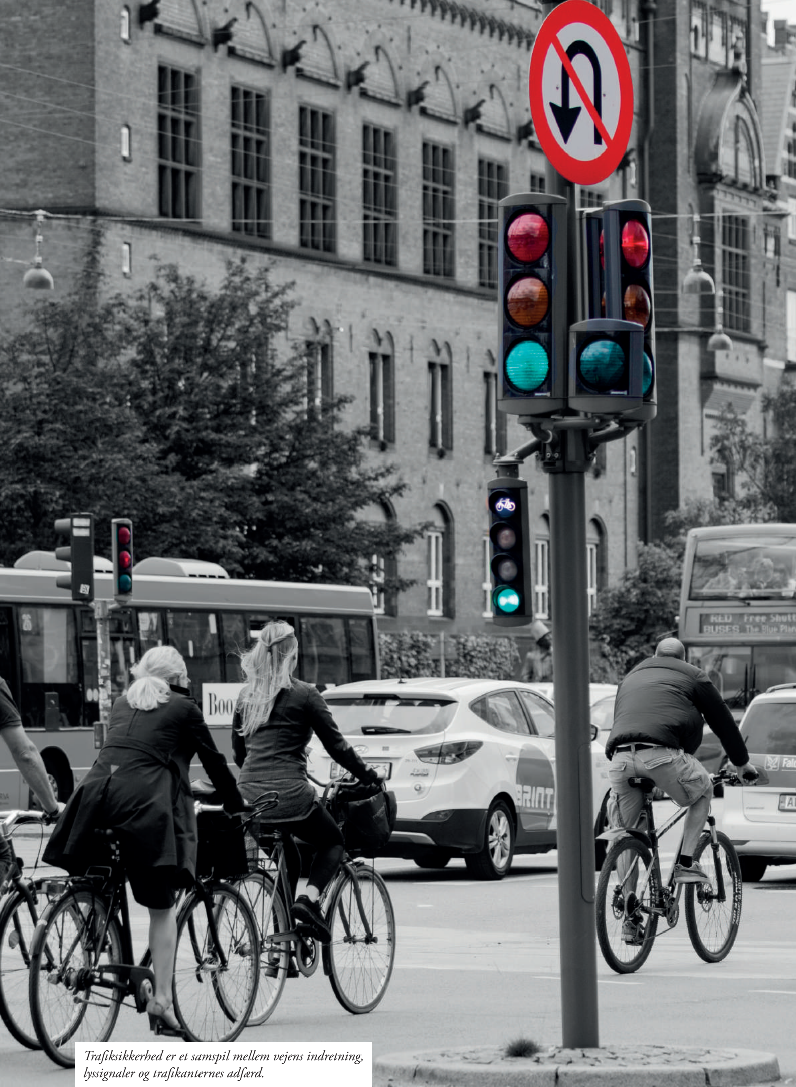
Trafiksikkerhed er et samspil mellem vejens indretning, lyssignaler og trafikanternes adfærd.