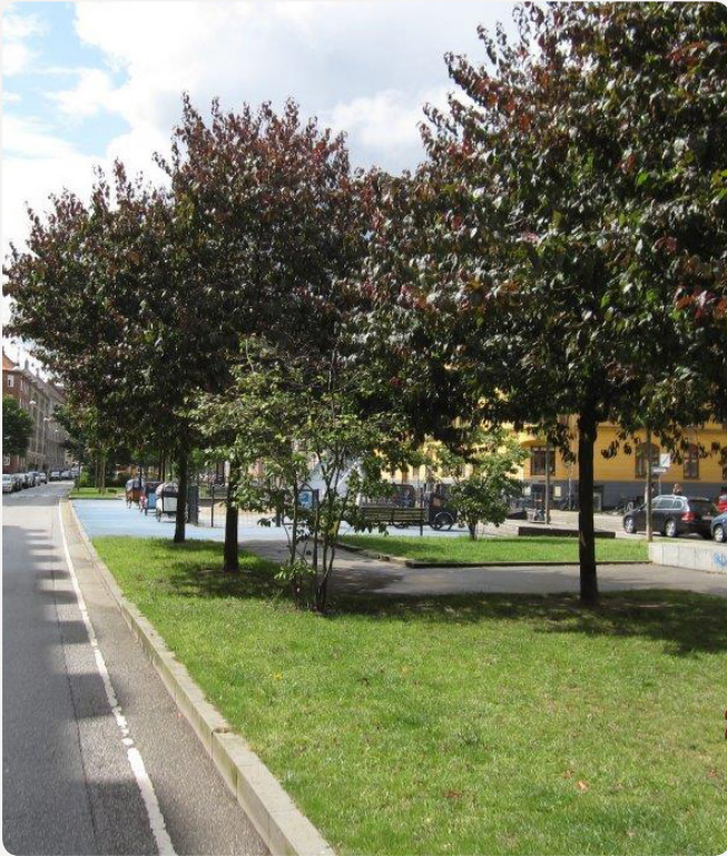
I forbindelse med renoveringen af Sønder Boulevard blev der plads til/bevaret træer, som er med til at skabe læ og skygge. Træerne er med til at skabe et trygt rum til ophold væk fra vejen