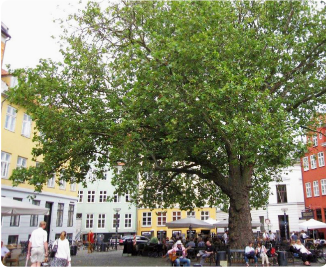
På Gråbrødretovr står et gammelt Platantræ, der er identitets-skabende for torvet.