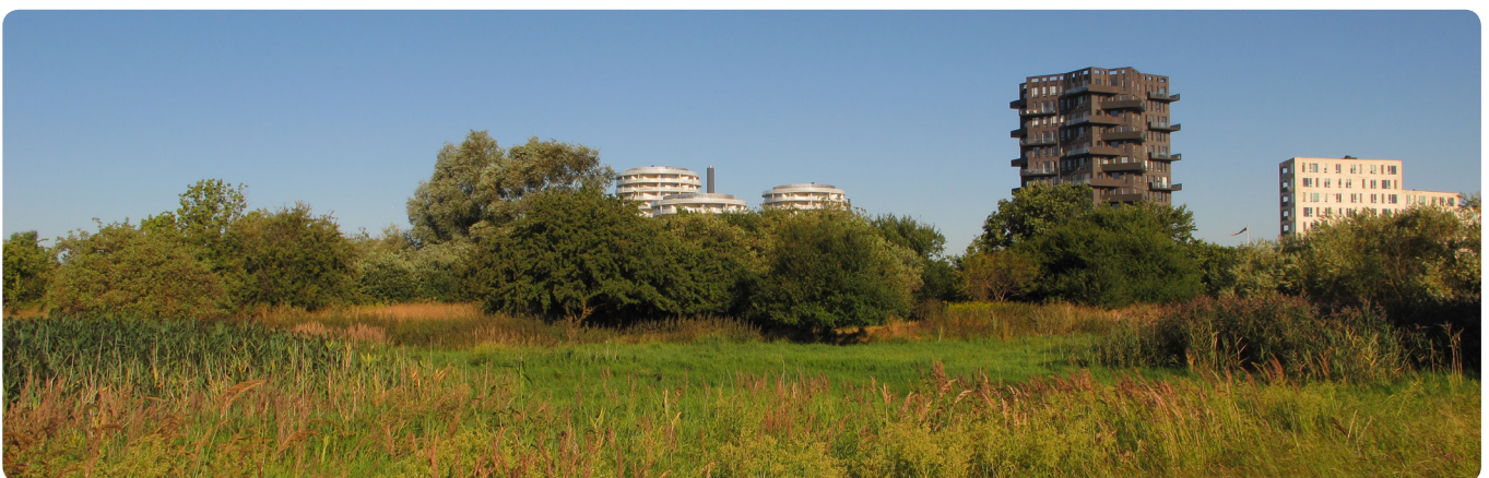
Træer i naturområder er ofte hjemmehørende arter. De er derfor vigtige bidragsydere i forhold til at øge den biologiske mangfoldighed, da de hjemmehørende arter er hjemsted for mange insekter og svampe.