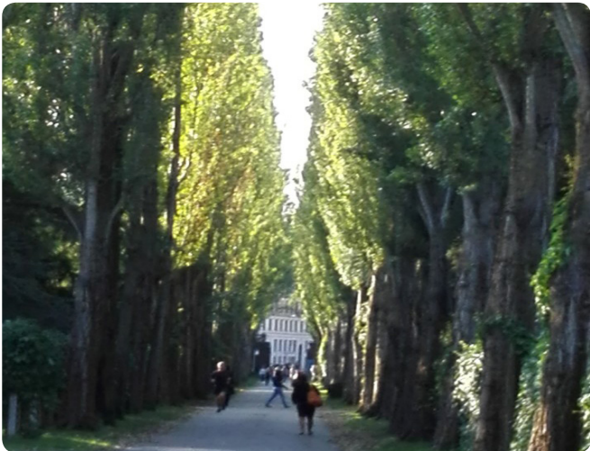
Træer er med til at skabe kulturhistorisk værdi og giver samtidig også naturoplevelser, som her på Assistens Kirkegård.