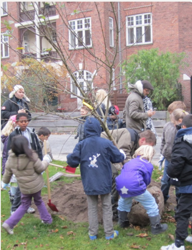
Skolebørn planter 'deres træ' i samarbejde med en gartner fra Teknik- og Miljøforvaltningen.