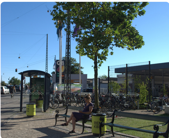
Træ der indgår i sammenhæng med de andre funktioner i byens rum.