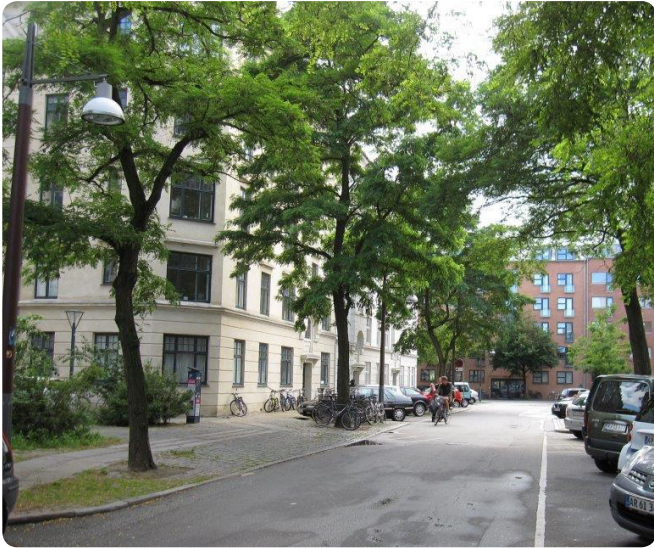
Gadetræer langs Tøndergade på Vesterbro.