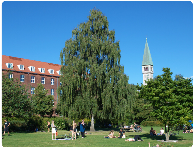
I byens parker er der plads til, at de store flotte solitære træer kan 'folde sig ud'. Parktræerne er med til at danne rammer for parkens rekreative funktioner, som det ses her i Enghaveparken.