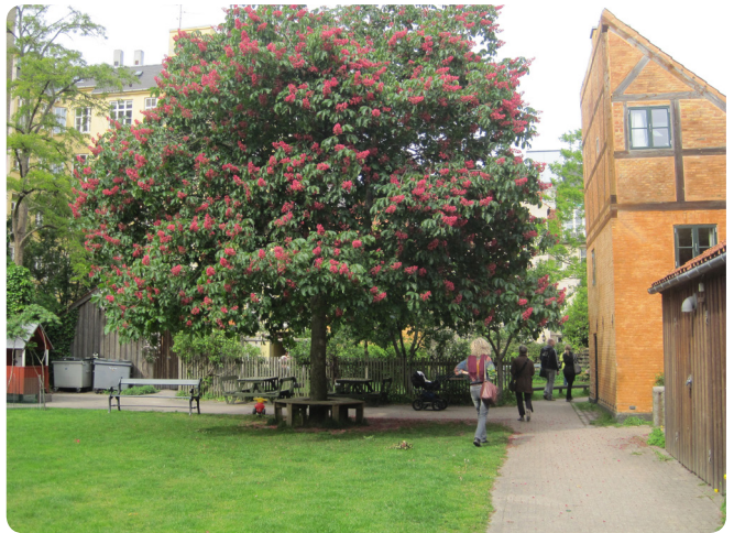
I mange af Københavns fælles gårdhaver gror der store træer, der giver gårdrummene en hel særlig karakter og identitet, som det ses her i en gårdhave på Christianshavn.