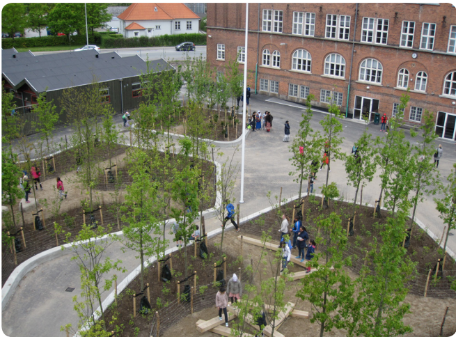
Amager Fælled Skole har fået landets første skovskolegård. Træerne er med til at danne ramme om spændende leg- og læringsmiljøer.