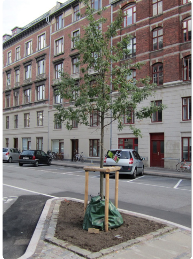
Eksempel på udnyttelse af byens rum til plantning af et nyt træ i et boligkvarter.