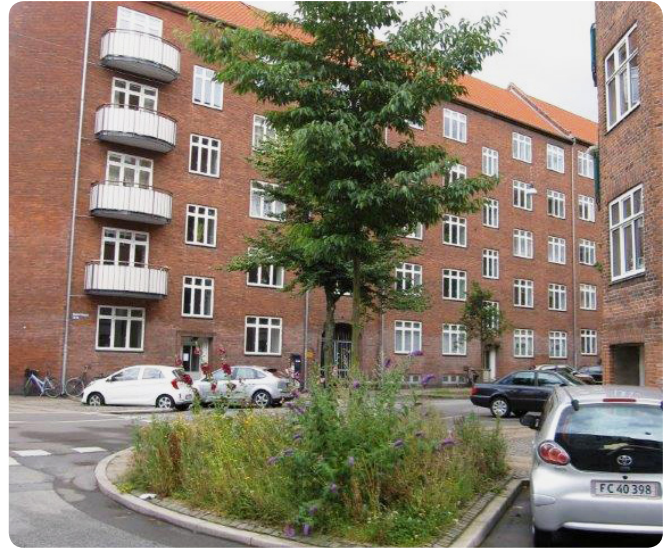
Gadetræ med underbeplantning.