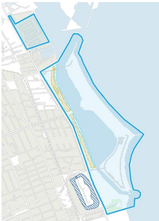
Fig. 1: § 3-kort fra Danmarks Arealinformation. Fredningsgrænsen for Amager Strandpark er angivet med blå streg. Naturtyperne strandeng (lyseblå skravering) og overdrev (orange skravering). Sø omkring Kastrup Fort (mørkeblå skravering) er udenfor fredningsgrænsen.

Ved Kastrup Fortet findes en søbeskyttelseslinje og fortidsmindebeskyttelseslinje, der rækker ind i planområdet, nærmere bestemt delområde 1b og 3a (se fig. 2). Indenfor begge beskyttelseslinjer er der et generelt forbud mod tilstandsændringer, men dette tillæg til udviklingsplanen for Amager Strandpark muliggør brugen af afbrænding uden forudgående dispensation fra disse, jf. fredningens § 11. Skal afbrænding foretages på de § 3 udpegede områder, skal der søges om dispensation til dette, jf. Naturbeskyttelsesloven.