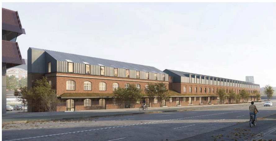
Illustration af det ansøgte projekt, Folke Bernadottes Allé

På den baggrund vurderer forvaltningen, at der med den tidligere dispensation er foretaget en afgrænsning af bygningsvolumeners placering. Forvaltningen vil på baggrund af denne afgrænsning, hvor de højeste bygninger i forhold til Kastellet ligger bagved kirken og stiftelsen, meddele afslag til dispensation fra naturbeskyttelsesloven til opførelse af to ekstra etager på længebygningen, Folke Bernadottes Allé