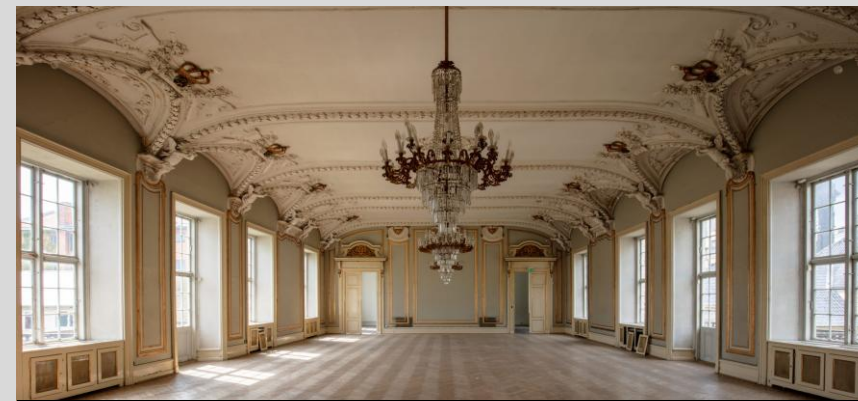
Festsalen i det kommende Musikhuset København