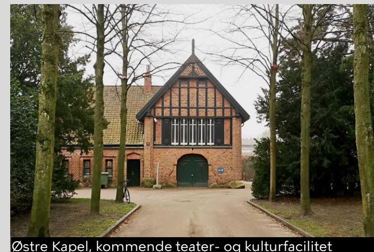
Østre Kapel, kommende teater- og kulturfacilitet