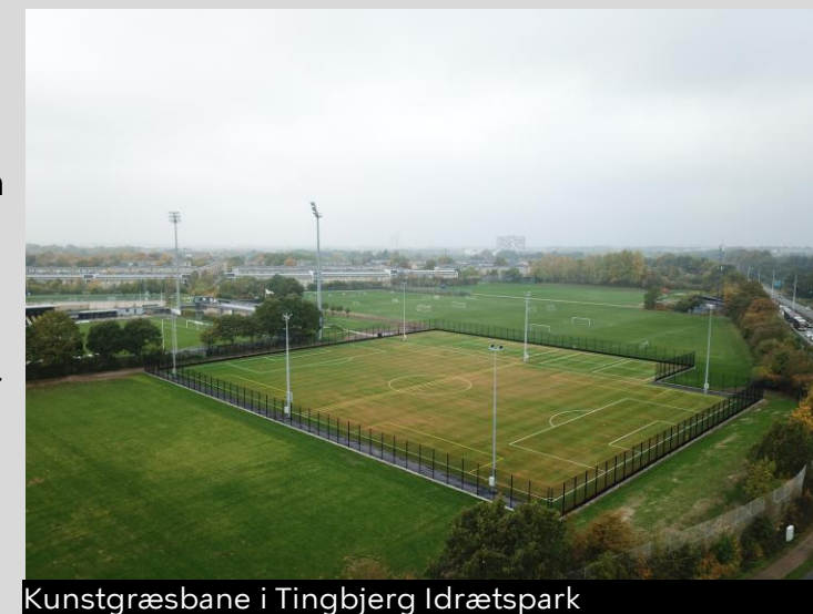
Kunstgræsbane i Tingbjerg Idrætspark