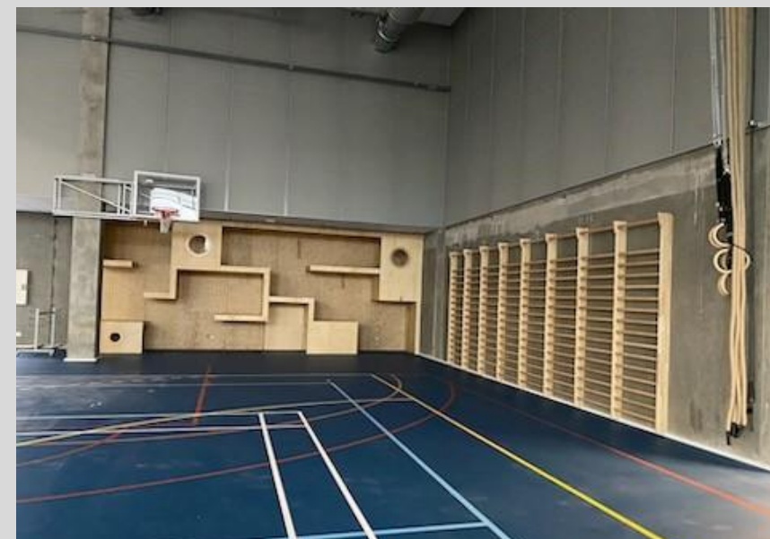
Idrætshal i den nye skole ved Dybbølsbro