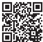
Layout: TMF Grafisk Design Tryk: Stibo Complete © Københavns Kirkegård 1. udgave 2024

Gratis, guidede ture på Bispebjerg Kirkegård Hvert år fra april til september er der gratis, offentlige rundvisninger på Københavns Kirkegård, herunder Bispebjerg Kirkegård. Grupper kan bestille separate ture hele året. Scan koden nederst på siden og læs mere om vilkår, tidspunkter og emner. Hent app'en og få en digital rundvisning Kom på rundvisning, præcis når det passer dig. Hent den gratis app, læs de gode historier og find let rundt blandt gravstene på egen hånd. Du finder app'en ARTOUR, hvor du normalt henter dine apps. Søg på bispebjerg , når du har installeret den.