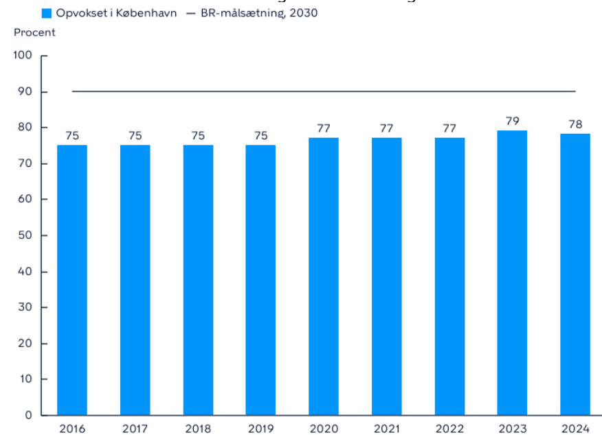
Figur 2: Andel 25-årige med afsluttet grundskole i København og fortsat bosat i kommunen med gennemført ungdomsuddannelse