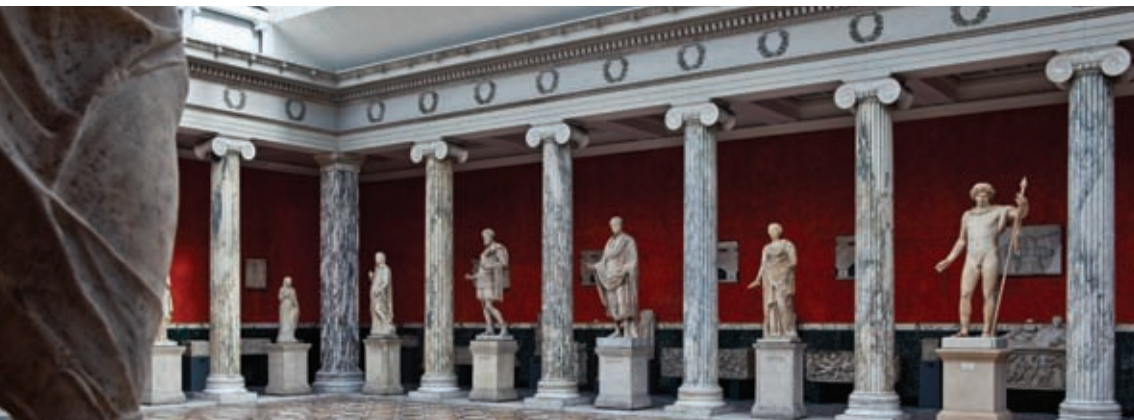
Ny Carlsberg Glyptotek