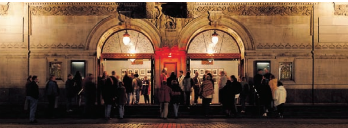
Aarhus Teater