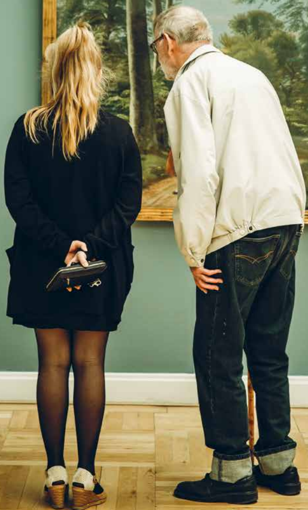
Det er vigtigt at forstå, at kunsten er et udtryk for menneskets kreativitet og evne til at skabe noget nyt. Det er også vigtigt at forstå, at kunsten er et udtryk for menneskets evne til at reflektere over sig selv og verden omkring sig. Det er derfor vigtigt at se kunsten som et udtryk for menneskets evne til at tænke og føle.