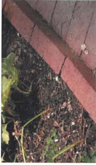
Adskillelse af sti og plaza fra de beplantede arealer med brug af vertikale mursten.