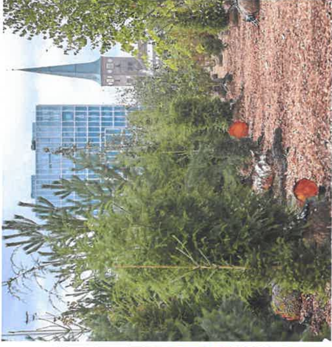
midlertidig urban skov i Aarhus.