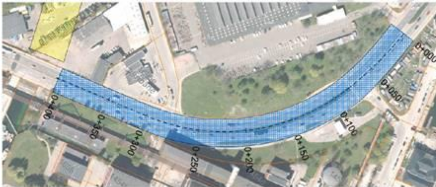
Skitser af mulige forløb for overdækning til henholdsvis Kortløb (øverst) og Vasbygade 10 (nederst)

Teknik- og Miljøforvaltningen har over for grundejerne bemærket, at en overdækning kan være hensigtsmæssig, da den både vil udgøre en støj-afskærmning og binde områderne sammen ved eksempelvis at lade landskabet gå op over vejen og forbinde til den planlagte park på sydsiden af H.C. Ørstedsværket. Teknik- og Miljøforvaltningen vurderer desuden, at Tømmergravsgade ikke bør omlægges, og at der også skal etableres nødspor under overdækningen.