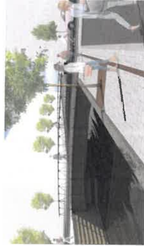
Sådan kommer fremtidens broer til at se ud. Med deres træ og stål-design kommer de til at bidrage til områdets smukke kanalæstetik.

Ved etableringen af de tre broer skal der tages hensyn til ombygningen af det komplekse ledningsnet, som løber langs vejen og dermed i broerne. Det er alt lige fra vand og kloak til el og data. Alle broer får en gennemsejlingshøjde på 1,20 m – samt tilpas stor vandgennemstrømning, som sikrer vandkvaliteten i kanalerne.