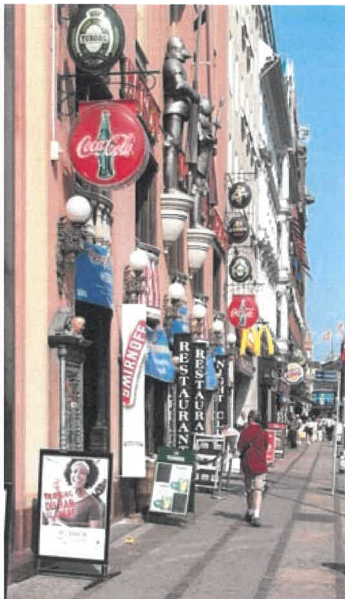
For mange skilte virker forvirrende på potentielle kunder.

Principielt kræver al form for skiltning og reklamering nemlig kommunens godkendelse.