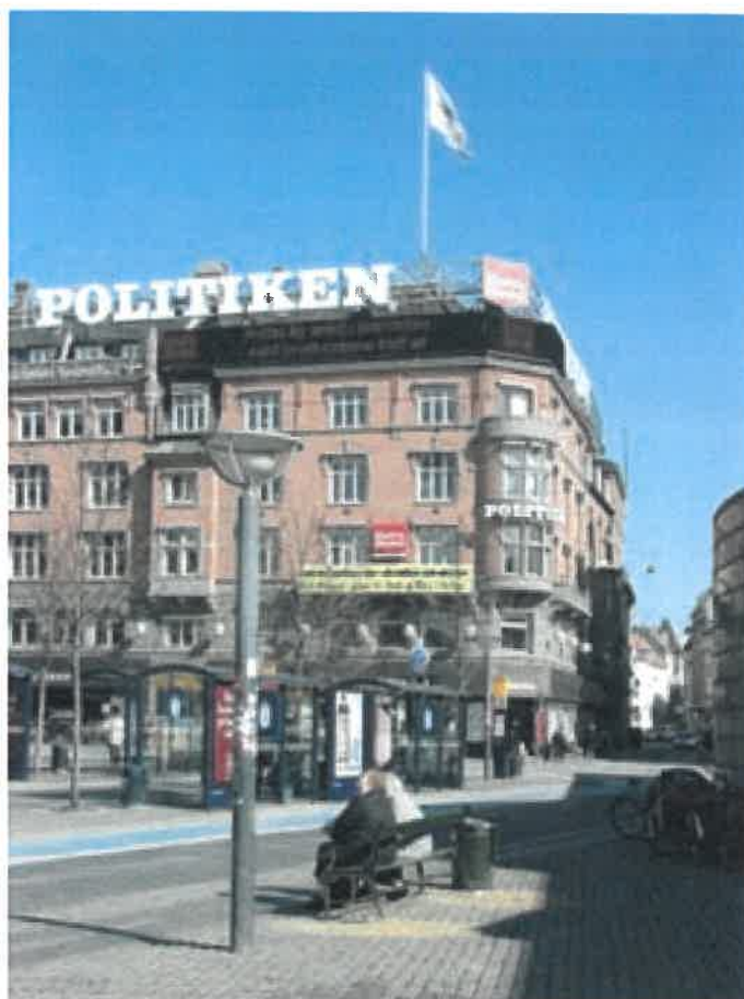
Reklamer på Rådhuspladsen er med til at understrege pladsen som knudepunkt.

Med retningslinierne ønsker kommunen både, at særlige bymæssige og trafikale knudepunkter understøttes og samtidigt sende signalet om en aktiv og levende storby. Oveni skal et hensyn til byens særlige kvaliteter, herunder de historiske byområder, sikres. Retningslinierne skal derfor også tilgodese, at følsomme områder i byen beskyttes mod store reklameindslag.