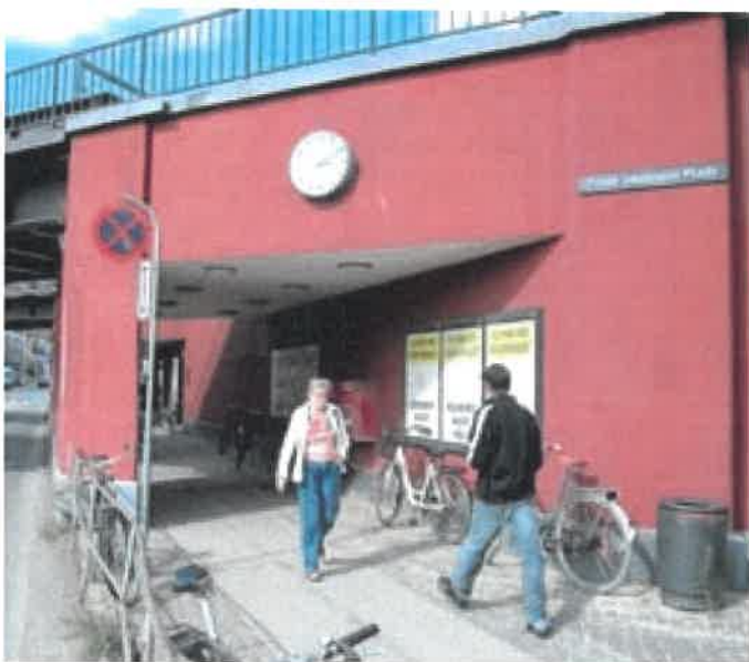
Belyste reklameskabe i gangrumarealer kan virke tryghedsskabende.