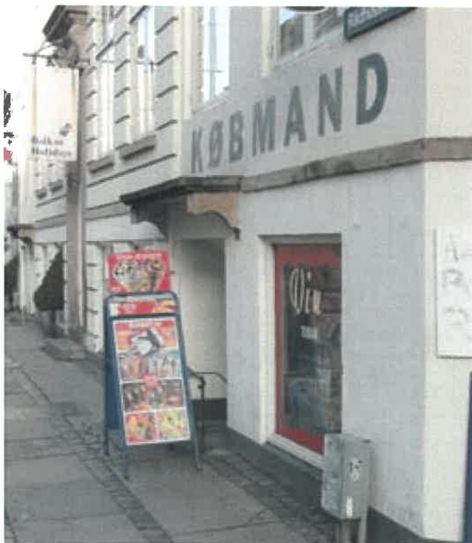
Skilteudstyr placeret på fortovsareal bør generelt begrænses.