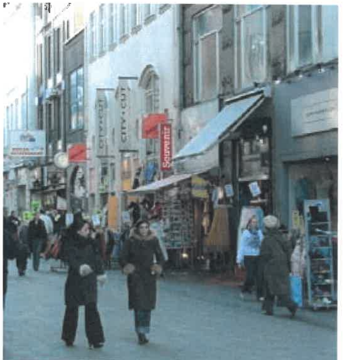
Skiltningen i den Indre By skal tilpasses byens småskala og må ikke sløre bygningens facader.