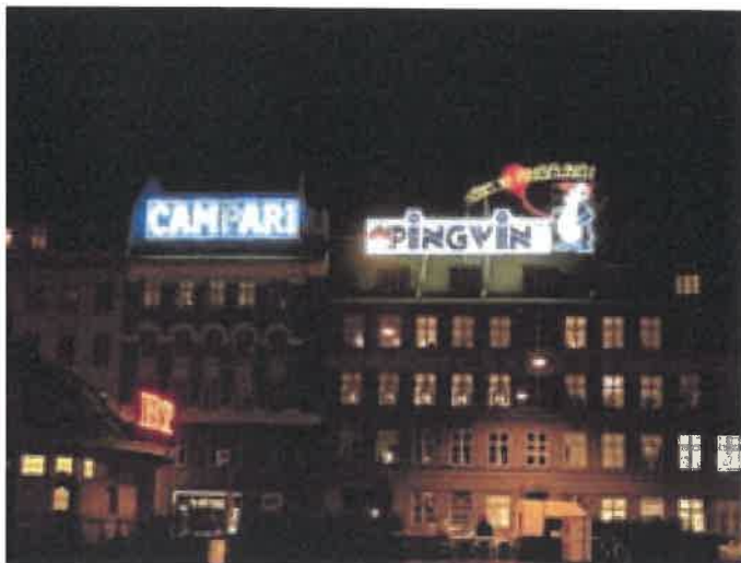
Lysreklamer er med til at sende et signal om en dynamisk og levende by og kan give et festligt udslag.