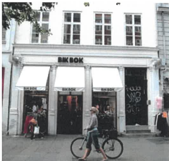
Markiserne her respekterer bygningens fagdeling. Skiltning sker på markisekanten.