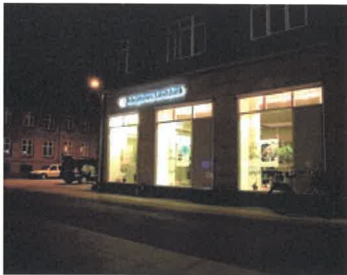
Skiltebelysning med coronaeffekt løser på fin måde blændingsproblemer.