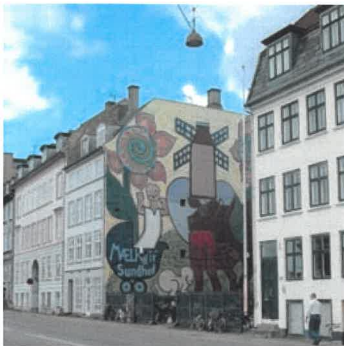
Heerups kendte mælkeklame fra Sølvgade.