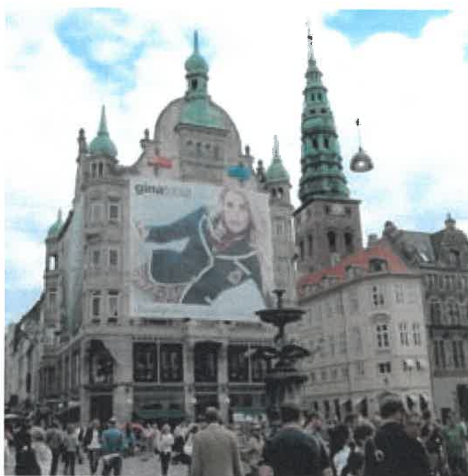
Reklameduge tillades generelt ikke. Reklameduge tillades kun på stilladser i forbindelse med renoivering af facader og tage.