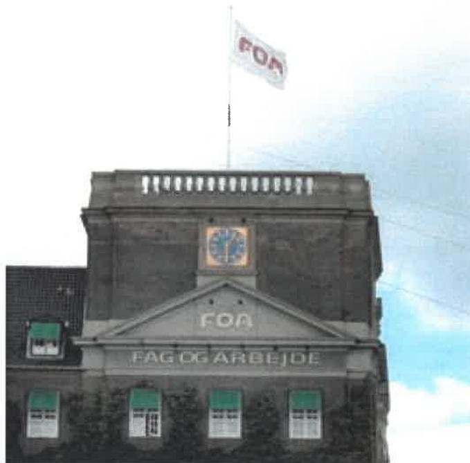
Det er tilladt at flage med firmalogo som her på hustage.