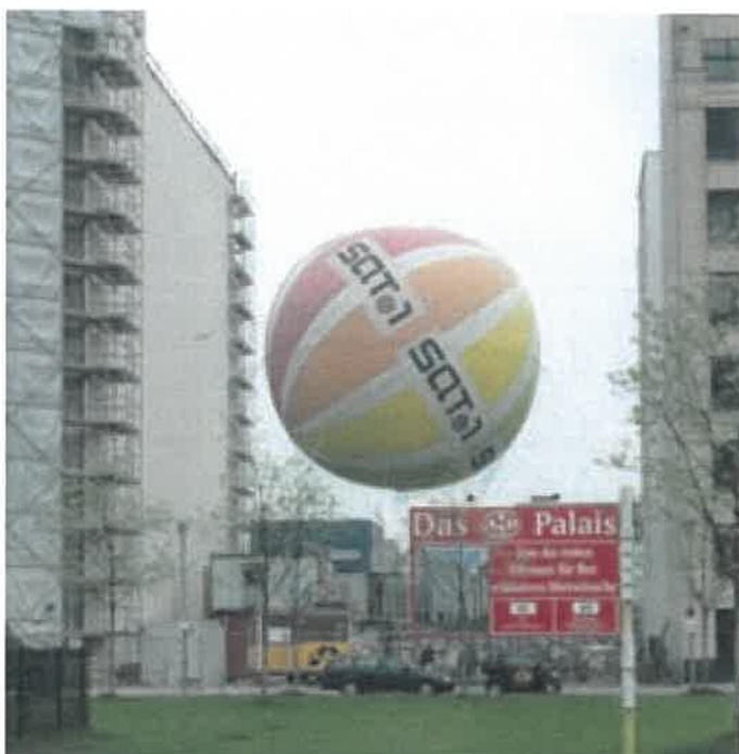
Reklameballon tillades kun undtagelsesvis i forbindelse med særlige events.