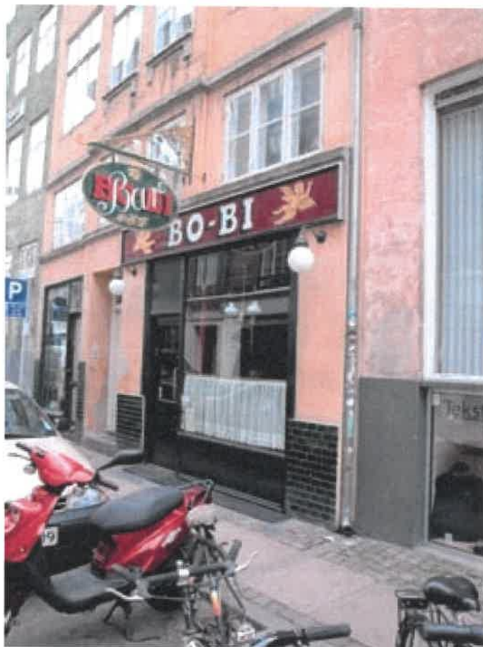
Skiltningen formidler på en enkel måde hvad der forhandles og butikkens navn på en måde som er fint tilpasset kvarterets arkitektur.

Det er afgørende for en god skiltning, at forbrugeren ikke forvirres af for mange informationer. Skiltningen skal derfor være enkel, klar og tydeligt formidle, hvad der forhandles. Skiltningen må gerne være fantasifuld og af høj kvalitet, hvad angår design og udførelse.