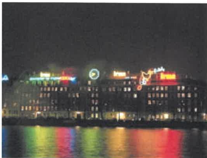
Lysreklamer kan være med til at skabe en bymæssig identitet.

På kortet bagest er udpeget de områder i byen, hvor kommunen er indstillet på, at der opsættes lysreklamer.