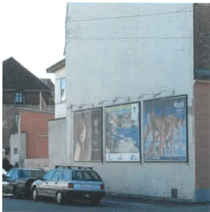
Billboards kan opsættes på brandgavle i industriområder og på byggepladshegn.