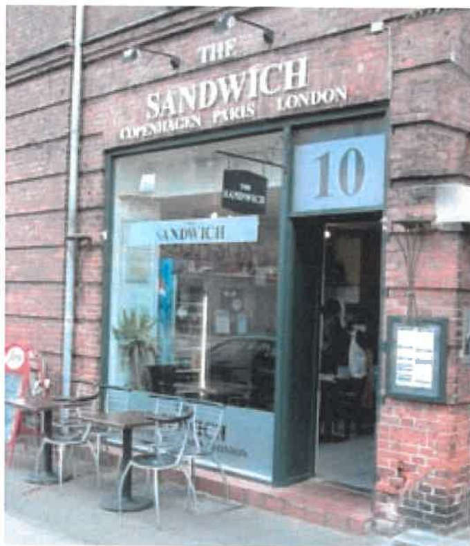
Her har man opnået en fin harmoni mellem skiltningen og bygningens facade med dens materialer og detaljer.

Ved kælderbutikker, hvor det ikke er muligt at placere et udhængsskilt inden for butikkens naturlige skilteområde, kan et skilt eventuelt placeres et andet sted på facaden, hvis bygningens arkitektur tillader det, og der ikke opstår gener herved.